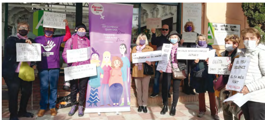
El 25-N, el col·lectiu feminista Dones 21 va llegir un manifest davant del Mercat i de l'Ajuntament, i l'edifici de ca la Cecília es va il·luminar de color lila en homenatge a totes les víctimes de la violència masclista.

La memòria del document assenya-la que "l'Ajuntament ja ha començat a desenvolupar accions relacionades amb la promoció i sensibilització vers l'equitat de gènere i per l'erradicació de les desigualtats i violències masclistes i de gènere al municipi", però constata que cal anar molt més enllà. Entre els punts forts de la situació de partida hi ha "les bones sinergies entre les entitats i el consistori" per abordar aquestes problemàtiques. També es valoren positivament les jornades i activitats de sensibilització i visibilització que s'organitzen a l'entorn del 8-M, el 28-J o el 25-N, així com la declaració institucional de "municipi feminista" i l'adopció de l'acord per a la "feminització del nomenclàtor oficial de carrers". Entre els punts febles de la diagnosi hi ha el pressupost "clarament insuficient" de l'àrea, dotat amb 7.500 euros, i la manca de personal tècnic propi, que es considera "imprescindible al més aviat possible". També s'hi troba a faltar un pla de formació específica per al personal municipal.