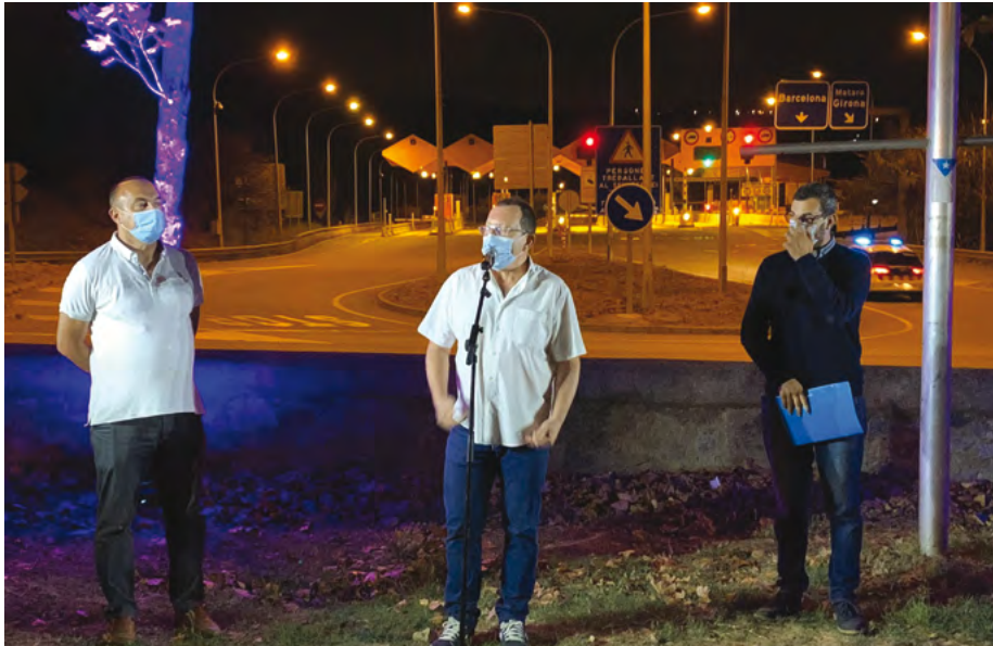
Els alcaldes del Masnou, Teià i Alella van celebrar l'alliberament del peatge.