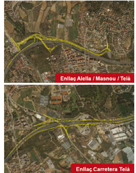
Les futures connexions de la C-32 amb Teià.

El passat 1 de setembre va expirar la concessió de l'autopista del Maresme que regia des de 1969. Des de llavors, la C-32 ha esdevingut gratuïta i el volum de trànsit s'ha incrementat sensiblement, la qual cosa ha donat peu a importants restriccions per venir cap a Teià des de l'antic peatge d'Alella.