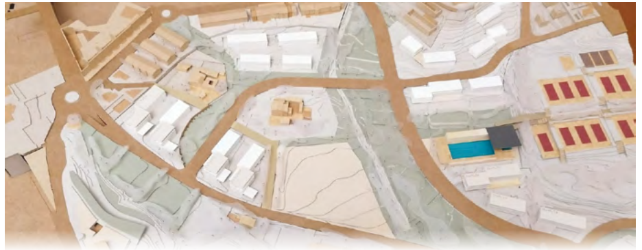
Proposta de la nova ordenació del Portal Urbà, entre el passeig de Massarosa i Sant Berger.

Des de llavors, el POUM ha estat objecte de cinc litigis promoguts per actors particulars. De tots els contenciosos, les administracions n'han guanyat