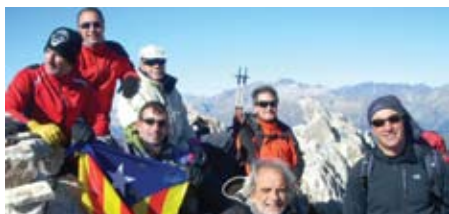
La Secció d'alta muntanya al cim de Vallibierna.

Si ens voleu conèixer més, ens trobareu a www.clubexcursionistateia.cat o teiaclubcet@hotmail.es ■