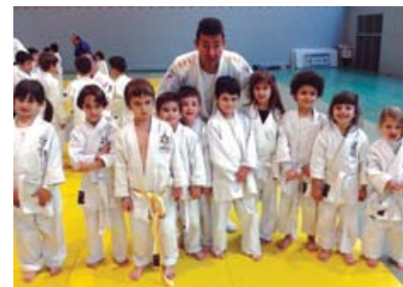
El club de Judo Amics Teià.

Van compartir moments també, amb la "Jaqui", la guineu i mascota infantil de la Federació, i tots els pares van gaudir mentre veien els seus fills practicant judo al tatami.