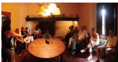
La Secció de Cultura a la sortida "Vilassar singular".