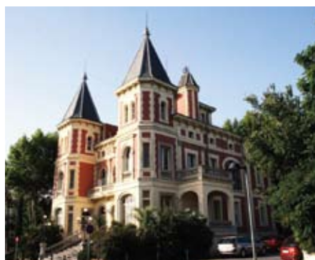
Casa del Marquès, al Masnou.

La rehabilitació de Casa del Marquès ha rebut subvencions de fons europeus FEDER i de la Diputació de Barcelona, i es preveu que es posi en marxa abans d'aquest d'estiu oferint espais a emprenedors i empreses i la possibilitat d'allotjament empresarial, ja sigui en règim d'incubació o de consolidació.