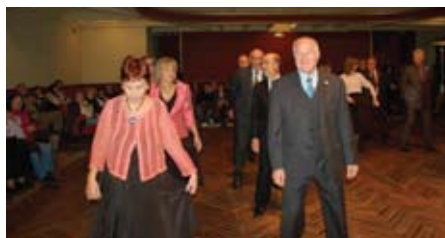
La parelles fent el ball.