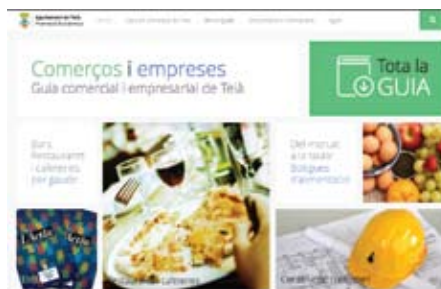
El nou web guia.teia.cat

No deixeu de consultar aquesta nova eina, accessible també a través del mòbil, perquè de ben segur que us sorprendrà la quantitat de serveis que ens ofereix el nostre municipi! ■