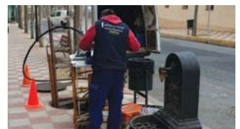
Un operari instal·lant la fibra òptica.

Actualment estem pendent que l'empresa ens informi de quines són les zones que quedaran fora de cobertura, per tal d'habilitar a través del web municipal formularis de demanda d'aquest servei, reclamant a l'empresa que n'ampliï la cobertura. ■