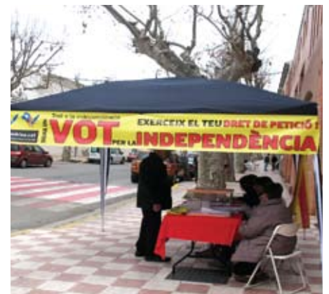
Recollida de signatures dins la campanya "Signa un vot per la independència".

Per a aquelles persones que tinguin problemes per desplaçar-se, si un familiar o amic ho comunica a qualsevol de les taules instal·lades, un apoderat es desplaçarà al lloc que ens indiqui perquè pugui signar el dret de petició. ■