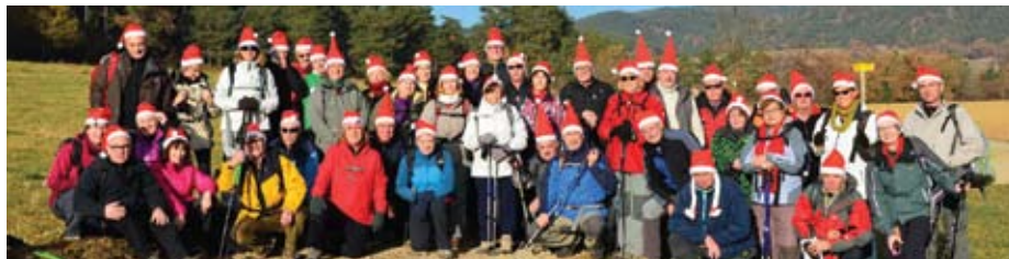
La Secció de Senderisme en la ruta Les Lloses-Sora.

Aviat ja farà un any que arrencàvem amb l'activitat de Running Express , nascuda amb l'objectiu de reunir tots aquells teianencs i teianenques que gaudeixen corrent per la muntanya.