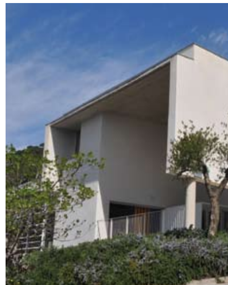
SI Turó d'en Baldiri.

En cap moment aquest canvi ha estat motivat per la qualitat educativa dels centres que imparteixen batxillerat. De fet, una família podrà escollir que el seu fill estudiï el batxillerat a l'Institut d'Alella però només hi tindrà accés si el centre té places lliures, el mateix que passava fins ara amb els instituts del Masnou. La situació ideal hauria estat la creació d'una zona única per a la secundària postobligatoria entre el Masnou, Alella i Teià, però fins ara no ha estat possible. ■