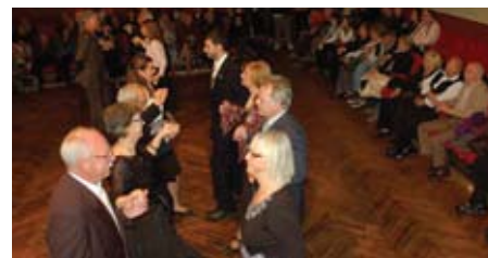
Moments del ball recuperat dels Llancers.