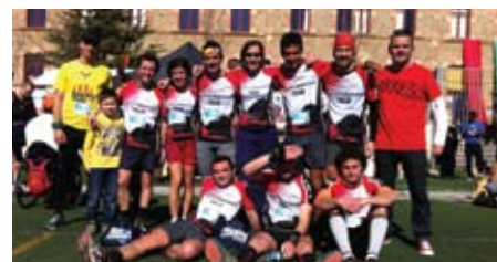
El nou equipament del CET a La Cabri-lença.