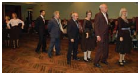
El ball dels Llancers al Teatre de La Palma.