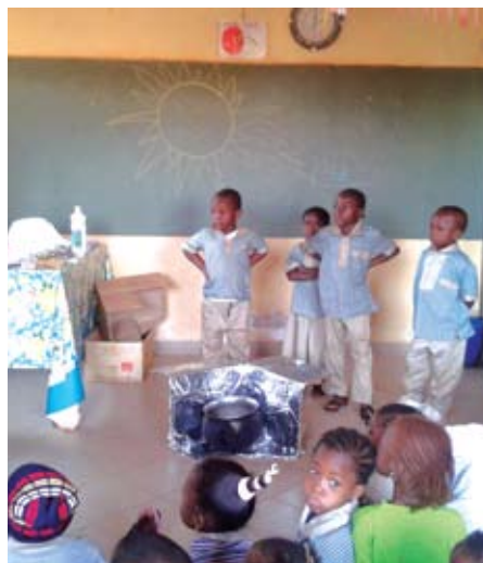
Els nens col·laborant en el taller.

Si vols conèixer més sobre nosaltres, entra a www.ccong.es