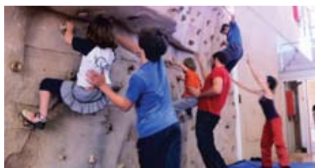
L'activitat extraescolar d'escalada per a infants.