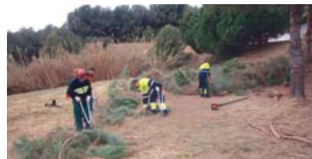
Els treballadors fent tasques de desbrossament

L'Ajuntament de Teià s'ha adherit a la subvenció que atorga la Diputació de Barcelona destinada a dur a terme els Plans d'Ocupació. Aquests plans són programes destinats a promoure la contractació laboral de persones aturades per a la realització d'actuacions de caràcter temporal i d'interès general i social.