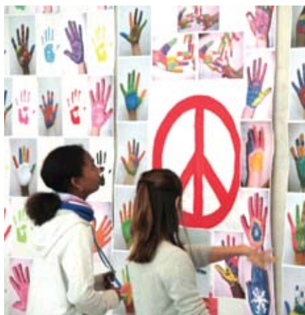
Els nois inaugurant l'exposició "La pau? A les teves mans".

Una altra sortida molt reeixida ha estat la sortida a la neu. L'alumnat de 3r i 4t van