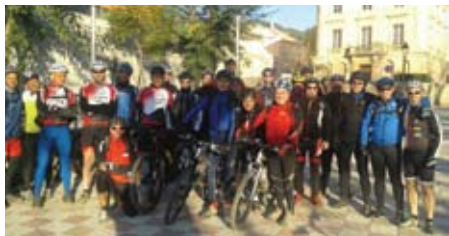
Els participants del BikExpress.