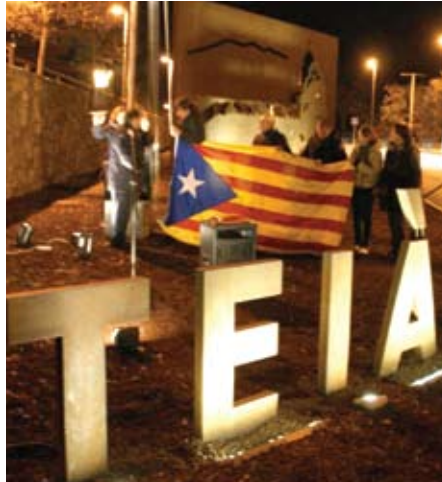
Hissada de l'estelada a l'entrada del poble.

Estem governats per uns personatges instal·lats en els seus càrrecs, i molts allunyats dels seus electors. Polítics que amb les seves actuacions han anat augmentant la desconfiança dels ciutadans cap a