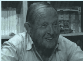
Julio Hospital, testimoni de la colònia Sueca Catalana de Teià