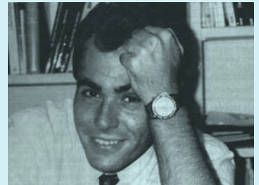
Jordi González, presentador de ràdio i Televisió