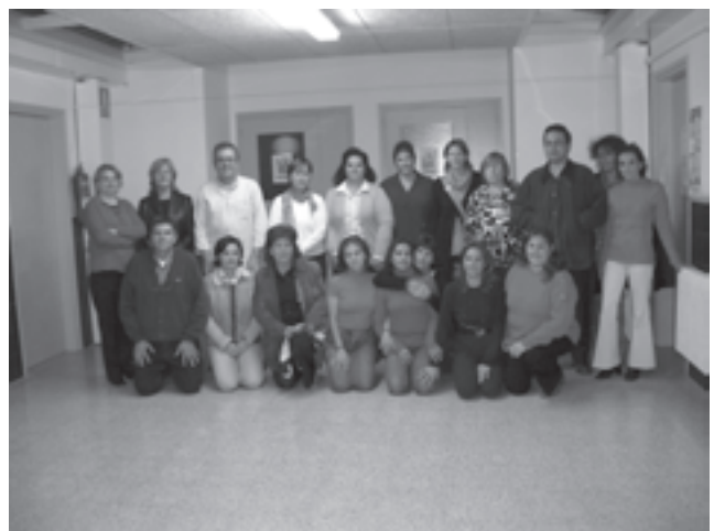
Assistents al curs d'Auxiliar de Geriatria

El vam iniciar el 8 de setembre i en horari de tardes de dilluns a divendres a l'Escola El Cim amb 20 participants. Actualment, ja en el darrer mes de formació, desembre, els alumnes