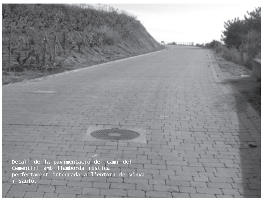
Detall de la pavimentació del camí del Cementiri amb llamborda rústica perfectament integrada a l'entorn de vinya i sauló.