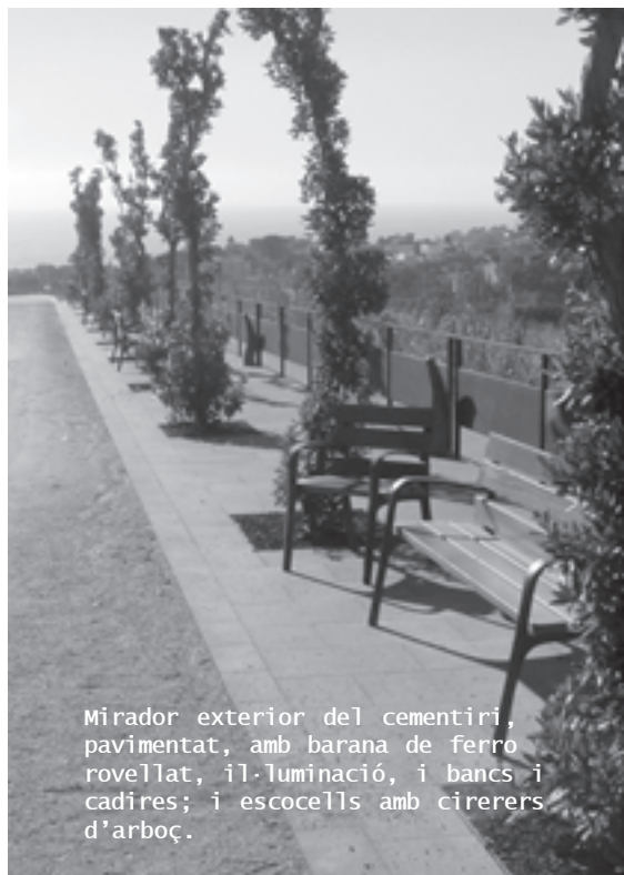
Mirador exterior del cementiri, pavimentat, amb barana de ferro rovellat, il·luminació, i bancs i cadires; i escoells amb cirerers d'arboç.