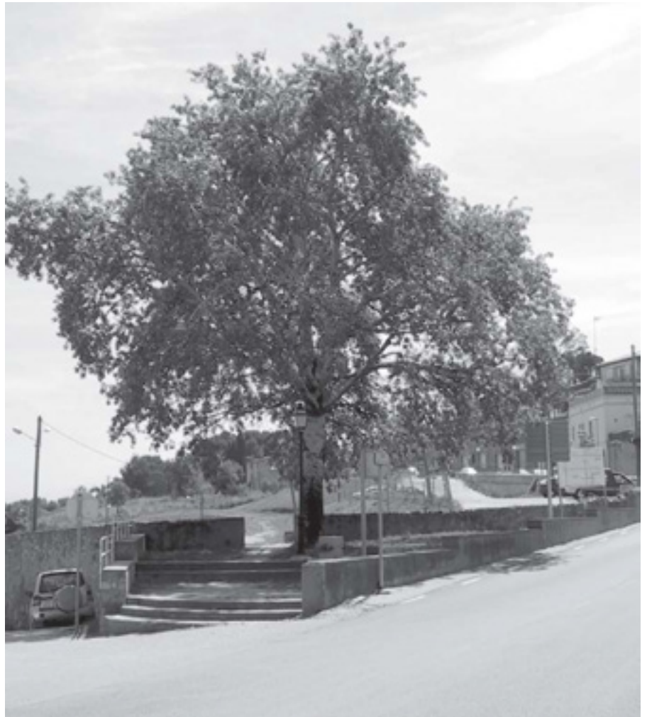
ARBRE CENTENARI A L'ENTRADA DE LA RIERA

S'ha creat la Comissió d'Estudi del catàleg d'Arbres i arbredes monumentals de Teià.