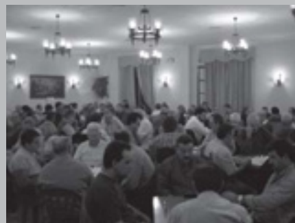
CAMPIONAT AL CAFÈ DE BAIX

Campionat de Catalunya: Es jugarà a Sitges els dies 26 i 27 d'abril. En el proper butlletí donarem el resultat de les 5 parelles representants de Teià.