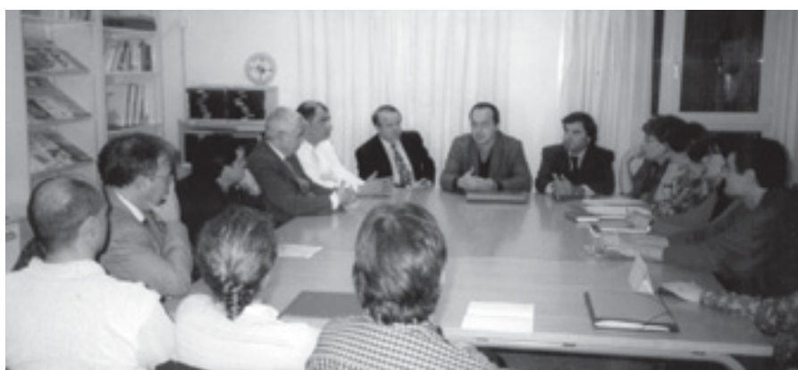
PASQUAL MARAGALL DURANT LA SEVA VISITA A L'ESCOLA EL CIM

L'Ajuntament va visitar el teatre de la Palma, les classes de reforç escolar que organitza el GRAMC en el Casal Parroquial, va fer un vol pel