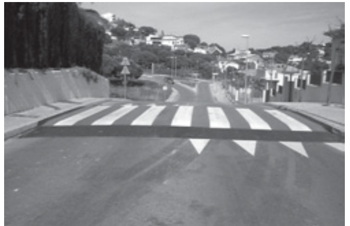
PAS ELEVAT AL CAMÍ A PREMIÀ DE DALT

Els passos de vianants elevats s'han distribuït sota criteris tècnics per tal d'evitar accidents i reduir de la velocitat a la zona. S'ha fet una àmplia senyalització tan vertical com horitzontal.