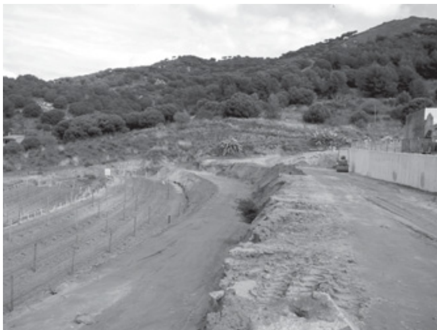
PART LATERAL DEL CEMENTIRI MUNICIPAL