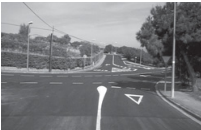
CRUÏLLA ENTRE ELS CARRERS LA VINYA MARINADA I GARBÍ. L'ASFALTAT ÉS NOU, AIXÍ COM TAMBÉ LA PINTURA.