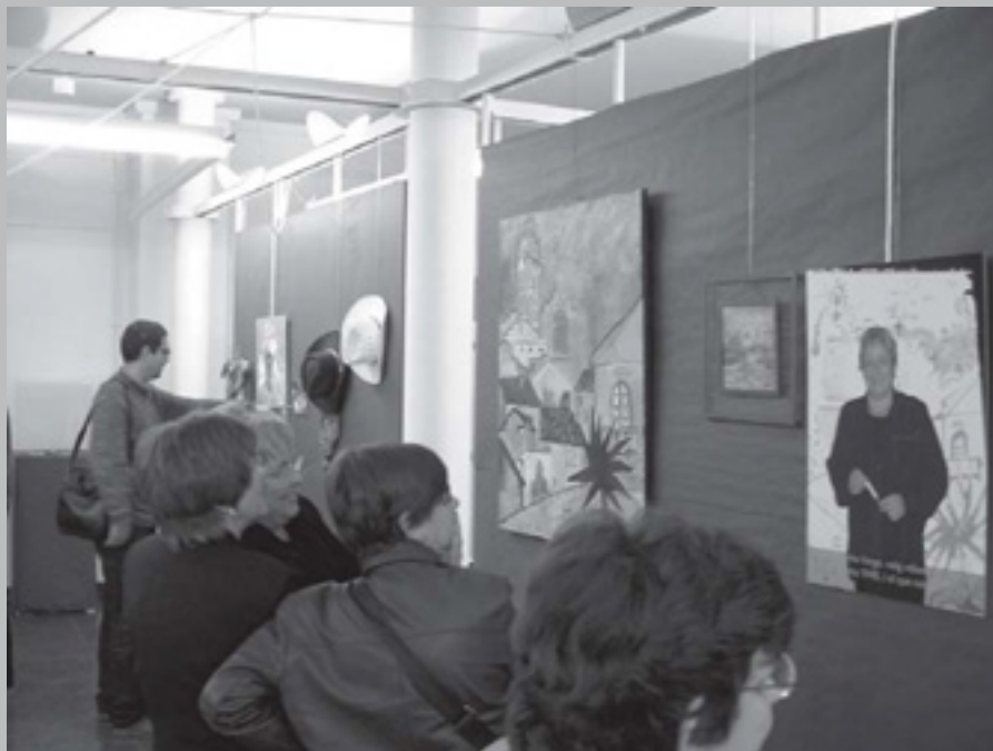
EXPOSICIÓ QUESEFER A LA CMC LA UNIÓ

grans riqueses que sovint desconexem. La veïna de l'escala, el company de la taula, el jubilat del casal, la noia saharauí, la companya de l'associació, aquell noi de Malí que va arribar l'any passat, o, per què no, el seriós regidor d'Hisenda o el professor de la Universitat, que ningú no ho sabia, però són uns grans actors còmics.