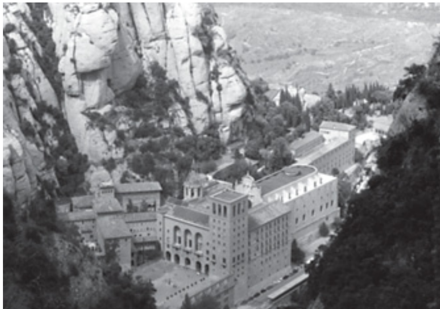
EL MONESTIR DE MONTSERRAT

Com cada any, el Casal d'Avis Gent Gran de Teià, amb el suport de la Regidoria de Benestar Social de l'Ajuntament, va organitzar la tradicional sortida a Monserrat.