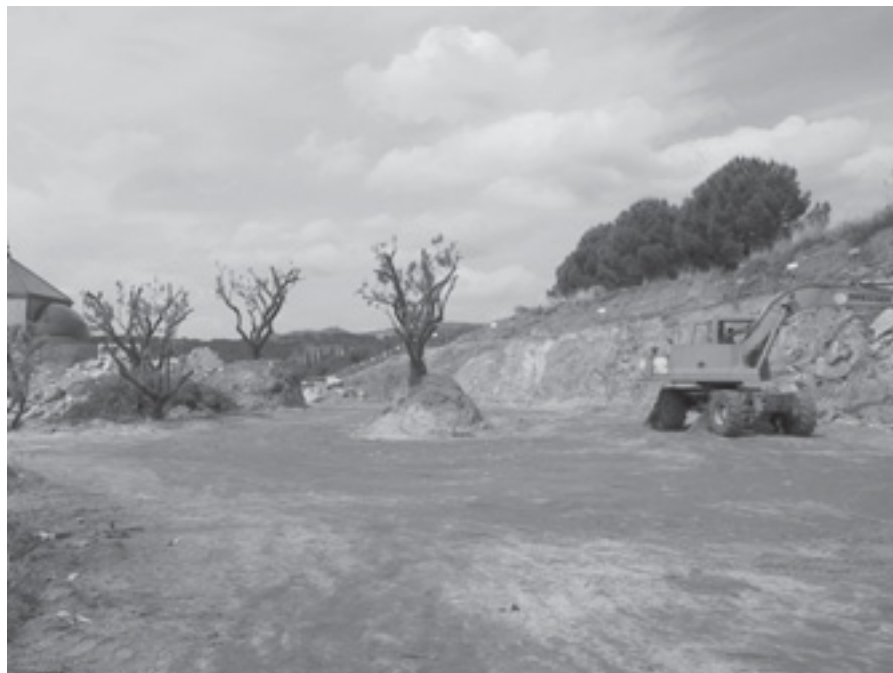
PART POSTERIOR DEL CEMENTIRI MUNICIPAL

Les obres d'ampliació del Cementiri avancen a bon ritme. És previsible la seva finalització dins el tercer trimestre d'aquest any.