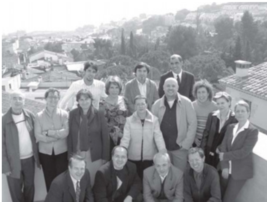
CANDIDATURA DEL PSC-TEIÀ

El que sí volem declarar és el nostre ferm compromís amb el diàleg, amb recerca del consens i amb el foment de la participació. I si hem de fer crítica, ho farem del problema, o de la situació anòmala, respectant els adversaris polítics i sense desqualificacions personals i mala educació. Per això, des de la nostra candidatura convidem a tots els que es presenten a treballar a l'Ajuntament (tots els homes i dones que participen en una o altra candidatura) a intentar trobar una data per fer una dinar conjunt, tothom té el dret i el deure de defensar les seves idees i els seus interessos però ni els uns ni els altres han d'evitar que ens respectem com a persones.