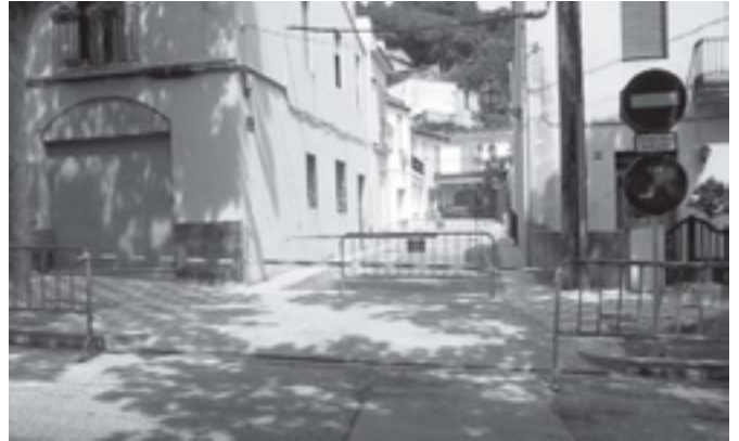
CARRER SANT JORDI

Ja hi som; carrer Llevant, Mossèn Cinto Verdaguer, en obres. Uns dies de molèsties pels veïns que ben segur sabran disculpar quan d'aquí a poc temps gaudeixin d'aquestes millores.