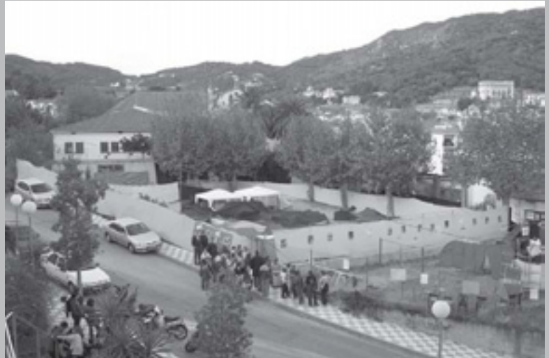
ESPLAI ITACA- FESTA MAJOR 2002

Tot i això, cal confessar que en el nostre cas la nostra millor recompensa és veure el somriure a la cara d'un nen, cosa que vol dir que s'està divertint i que el temps que s'ha invertit en la preparació d'una