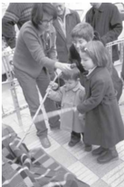
DOS NENS FAN CAGAR EL TIÓ EN EL TRADICIONAL CAGA TIÓ