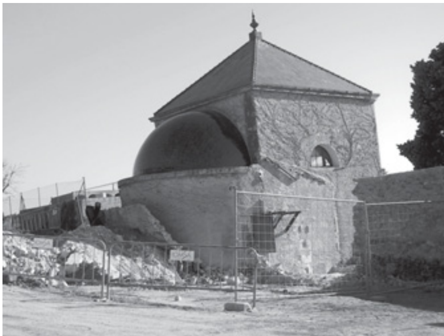
VISTA POSTERIOR DEL CEMENTIRI EN OBRES

El cementiri actual és un recinte limitat, acotat i tancat, hi ha un àmbit arquitectònic de dintre i fora. La proposta és un cementiri lliure amb una estructuració adaptada a la topografia existent per minimitzar l'efecte arquitectònic. Es preveuen recorreguts en diferent perspectiva