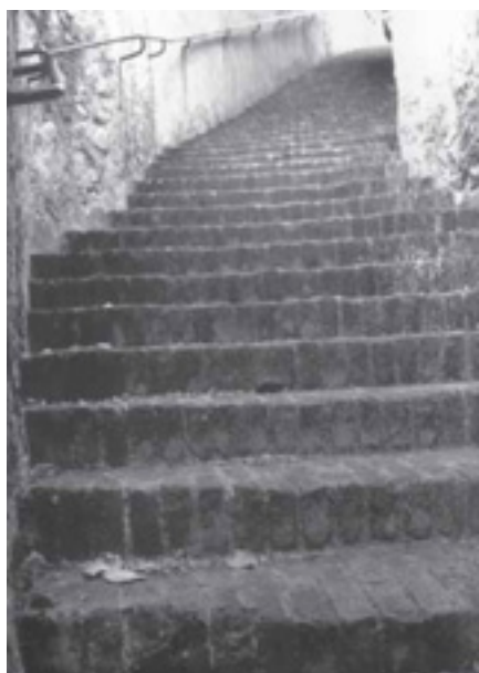
RACÓ DE TARDOR, GUANYADORA DEL SEGON PREMI, D'ANTONI FALCÓ

fotografia, varen emetre el següent veredict.