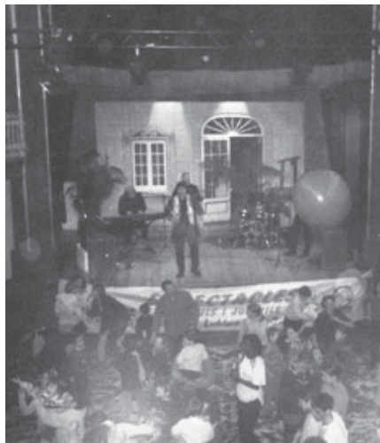
GRUP D'ANIMACIÓ «PENTINA EL GAT»

Durant tota la jornada es van realitzar activitats amb tres objectius clars: Oferir informació divulgativa sobre les Malalties Inflamatòries Cròniques : Artritis Reumatoide, Malaltia de Crohn i Colitis Ulcerosa ; fer una bona recaptació econòmica i viure un dia de convivència entre les entitats organitzadores i col.laboradores.