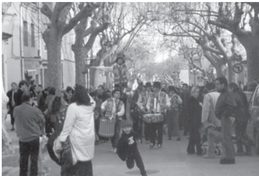
LA RUA DEL CARNAVAL INFANTIL EL PASSAT DIUMENGE 2 DE MARÇ

Les dues entitats i l'Ajuntament van organitzar el carnaval d'enguany