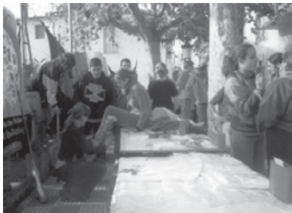
TALLER DE XANQUES

Ningú no sabia com s'aixecaria el dia, havia estat plovent i fent mal temps tota la setmana, però per TV havien anunciat una millora de cara el cap de setmana i així va ser. El dia ens va acompanyar amb un sol ben brillant, adequat perquè la gent sortís al carrer a participar amb les activitats que s'havien organitzat a