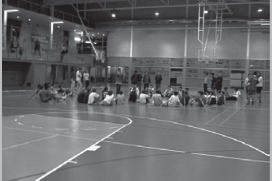
ELS EQUIPS DE BÀSQUET DURANT LA SESSIÓ D'ENTRENAMENT