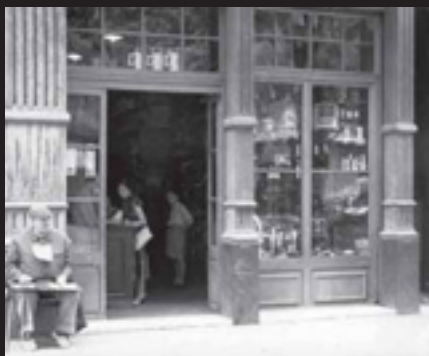
LA FERRETERIA VALLS EN ELS SEUS INICIS