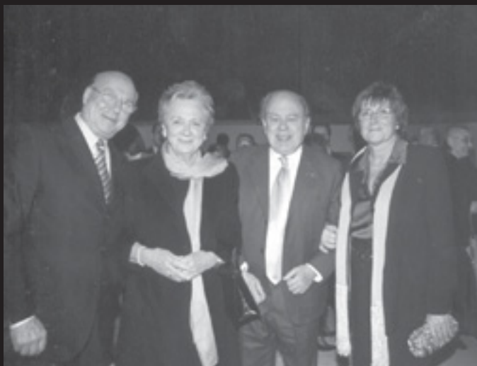
EN RAMON (A L'ESQUERRA) I LA SEVA DONA (DRETA) EL DIA QUE REBEREN EL PREMI DE LA MÀ DEL PRESIDENT DE LA GENERALITAT

També ha estat soci i fundador de Sant Antoni Centre Comercial, i l'impulsor de l'Associació de Veïns i Comerciants del carrer Comte d'Urgell, de la qual n'ha estat vice-president durant més de 15 anys.