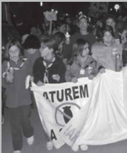
MANIFESTACIÓ PER LA PAU A TEIÀ EL DIA 22 DE FEBRER. FOTO: JORDI RIERA

Creiem en una societat on home i dona puguin viure alliberats de qualsevol servitud. Tot fent del respecte mutu una norma de vida personal i col·lectiva, que és la base