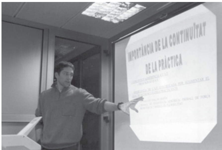
UN PONENT DURANT EL PRIMER CICLE DE XERRADES

El passat mes de gener vam començar aquest cicle que creiem és de gran interès per a tota la població. No només per a aquelles persones que practiquen algun esport en concret, sinó també per a tots aquells que pretenen millorar la seva qualitat de vida, o s'hi dediquen a aquest àmbit.