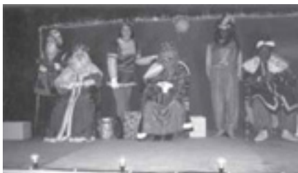
SES MAJESTATS ELS REIS D'ORIENT

Com ja és tradicional, les festes nadalenques s'acaben amb la tradicional Cavalcada de SSMM els Reis d'Orient. Enguany tot i que el començament va donar la sensació d'haver-hi menys participació a mida que anaven avançant, es va incrementar la participació de nens i nenes, que al final varen tenir de fer força cua per arribar a lliurar les seves cartes als Reis.