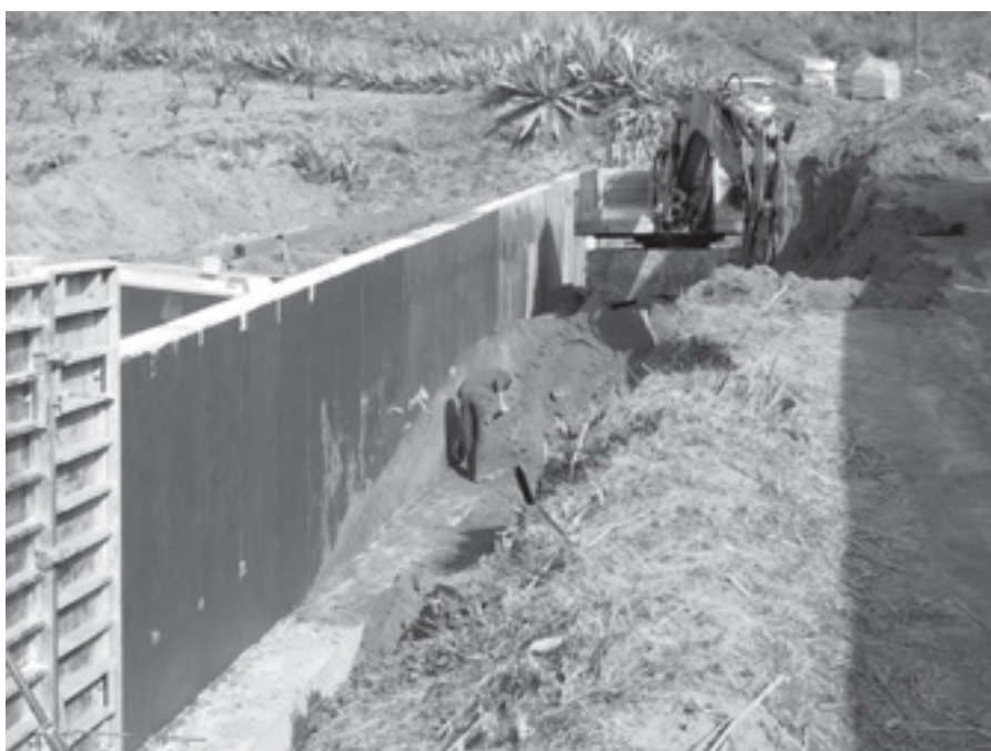
PART DE LA NOVA CONSTRUCCIÓ DE L'AMPLIACIÓ DEL CEMENTIRI

tràgic. Es materialitza unes formes geomètriques en diàleg amb el paisatge, així existeixen uns cubs seguint la corba de nivell enfrontats amb un mur de contenció que formalitzen els nínxols disposats longitudinalment, recuperant el concepte de mur i terrassa, és a dir, la tradicional feixa.