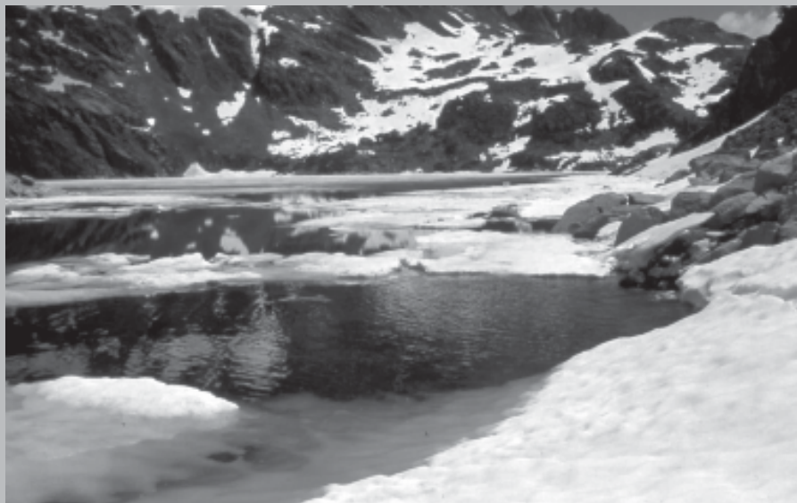
PONT NEGRE A 2.454 M.

Aquesta sortida ens va permetre conèixer el Pla de la Calma, ascendir al Puig Drau i als ciclistes fer un sorprenent descens (11 Km.)