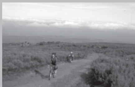
SORTIDA A COLL FORMIC-PLA DE LA CALMA

El 13 d'Abril una excursió a Coll Formic - Pla de la Calma (Puig Drau) - Montseny OPCIONAL AMB BICICLETA . La sortida de Teià va ser amb autocar fins a Coll Formic, on es va iniciar l'excursió, tant pels que anaven caminant com