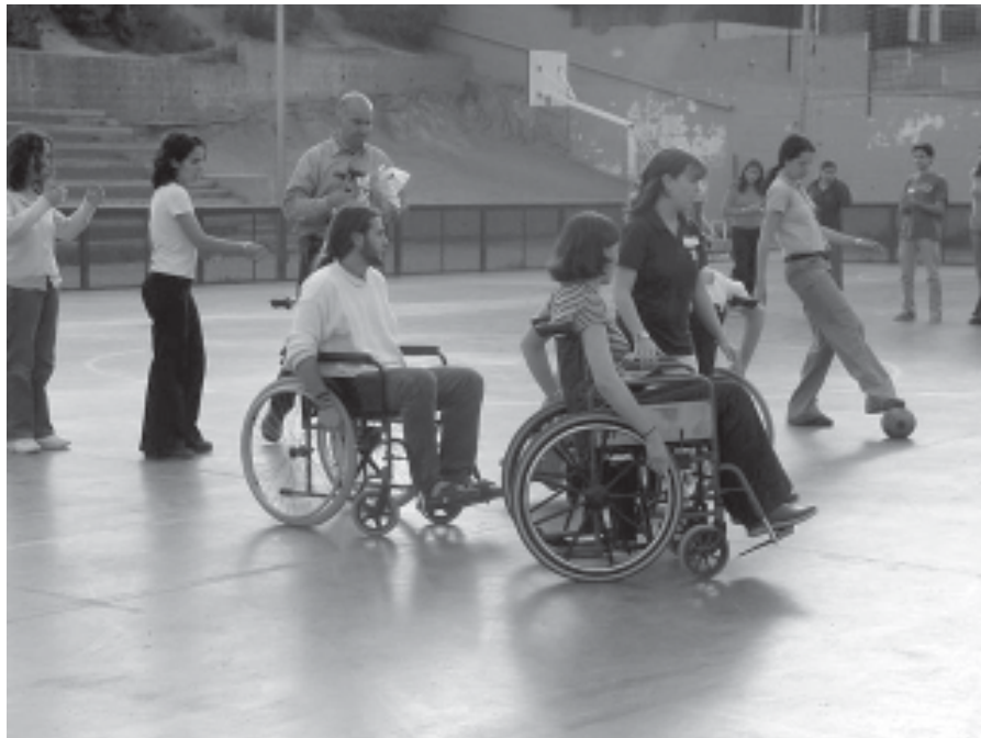
UN GRUP DE MONITORS PROVEN UNES CADIRES DE RODES

El curs es va oferir als monitors i educadors de lleure que realitzen una tasca educativa al nostre municipi.