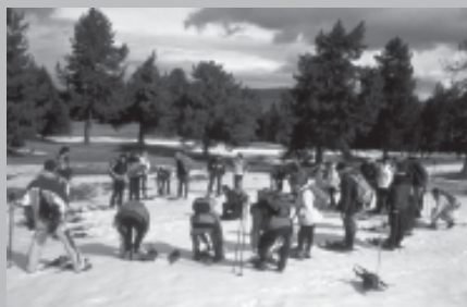
SORTIDA A LA MOLINA

Vam poder gaudir d'una magnífica vista de la plana de Vic, el cim del Matagalls i del Turó de l'Home i els cingles de Bertí.