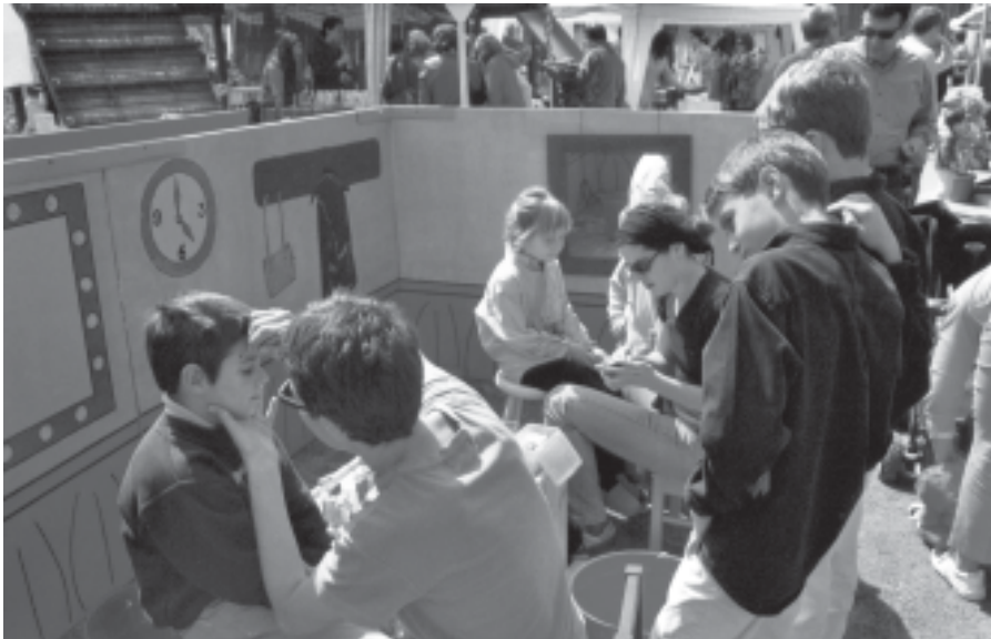
UNS NENS ES MAQUILLEN AL TALLER DE MAQUILLATGE DE LA FIRA

Tot i que pensàvem que la fira d'enguany s'hauria d'ajornar degut al mal temps, finalment no va ser així i aquesta es va celebrar el primer dia amb pluges sense parar i el segon amb un sol radiant.