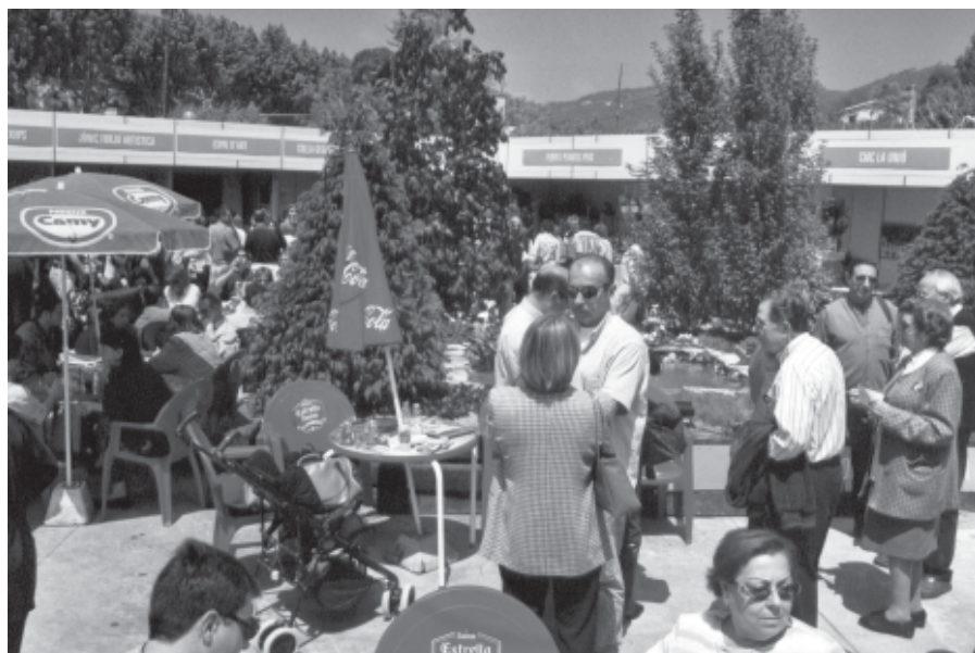
ASPECTE DE LA FIRA D'enguany