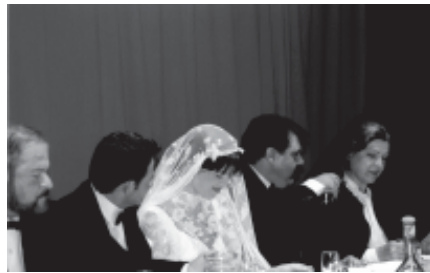
UNA ESCENA DE L'AUCA DEL SR. ESTEVE

Dijous, 18 de gener de 2001, 21h, Casino del Masnou: es presenta en societat i a la premsa comarcal l'agoserada empresa de la Coordinadora de Grups Amateurs de teatre del Maresme. I diem agoserada no pel fet que s'uneixin catorze grups de teatre per formar un ens de col·laboració, d'intercanvi i de passió pel teatre, sinó pel fet que trien L'Auca del Senyor Esteve com a tarja de presentació i com a primer treball en comú.