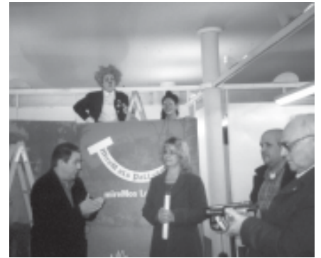
INAUGURACIÓ DE L'EXPOSICIÓ MIRA ELS PALLASSOS

Dins la X quinzena intercultural del GRAMC, en el seu desè aniversari, a més dels diversos actes en diferents llocs, els membres del GRAMC organitzaren a la Unió l'exposició (mira els pallassos), de Pallassos sense fronteres del 15 al