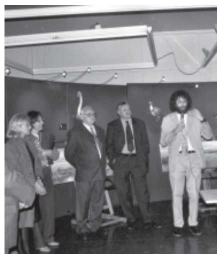
EL BIÒLEG DEL MUSEU E LA CIÈNCIA A LA INAUGURACIÓ

El dia 9 de maig i com a primera col.laboració amb la Fundació "La Caixa" es va inaugurar l'exposició