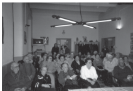
GRAN EXPECTACIÓ DURANT LA CONFERÈNCIA