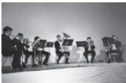
EL GRUP MIL·LÈNIUM BRASS QUE TAMBÉ VA ACTUAR DURANT LA SEGONA PART

Una participació molt interessant que ja fa uns anys tenim el plaer de comptar-hi, és la de l'Escola de Música CADENÇA, en la qual aquest any ens han ofert un concert a càrrec de diferents alumnes d'aquest centre que amb diferents instruments, com són violí, guitarra, flauta etc. han provocat els aplaudiments del públic assistent.