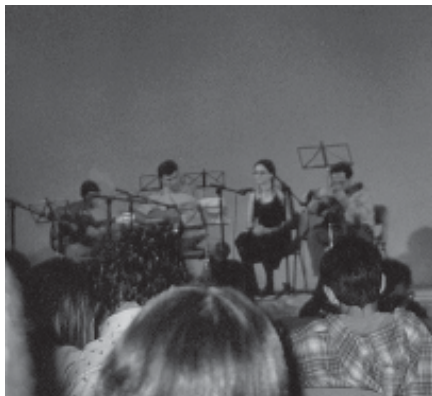
ELS ALUMNES DE L'ESCOLA CADENÇA DURANT L'AUDICIÓ

Una participació molt interessant que ja fa uns anys tenim el plaer de comptar-hi, és la de l'Escola de Música CADENÇA, en la qual aquest any ens han ofert un concert a càrrec de diferents alumnes d'aquest centre que amb diferents instruments, com són violí, guitarra, flauta etc. han provocat els aplaudiments del públic assistent.