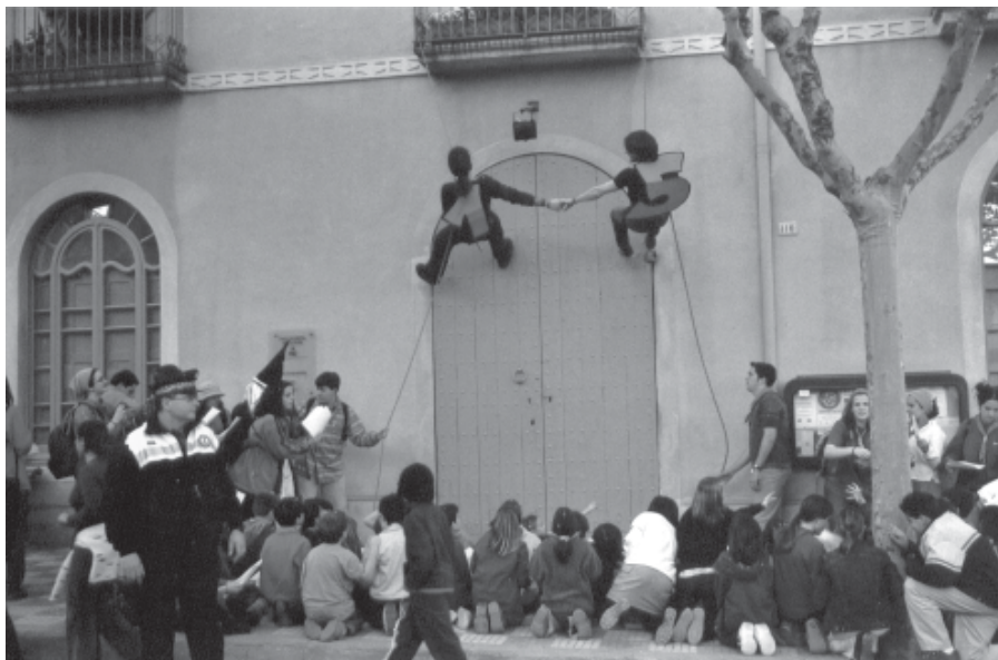
L'EXPOSICIÓ DE L'ESPLAI ITACA VA TENIR MOLTA AFLUËNCIA DE GENT

després ja els va compensar en veure la gentada que va acudir a la original inauguració.