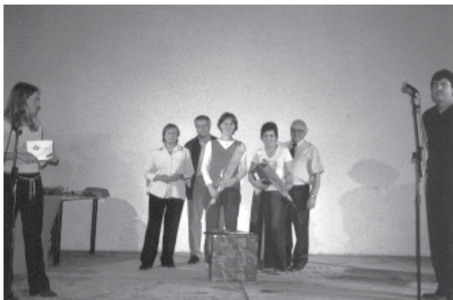
ENTREGA DE PREMIS ALS PARTICIPANTS DE LA MOSTRA