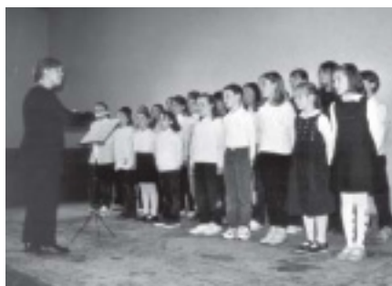
LA CORAL PICAROL

actes programats, va tenir lloc un concert mixte, en el qual varen participar la Coral Picarol, petits i mitjans, la Coral Esclat i els alumnes de l'Escola de Música Cadença, fent tot plegat un concert prou interessant, en què va destacar l'actuació de la Coral Picarol mitjans, que pronostica un bon planter de cara la continuïtat de la Coral Esclat. Un acte a destacar fou l'actuació de l'Orquestra AMICS DE LA MÚSICA de Barcelona, una formació composta de cinquanta músics, però que cap d'ells es dedica a la música professionalment, tot i així, ens varen oferir un bon repertori de peces més aviat populars, dit d'una altra manera peces molt conegudes, en las quals cal destacar l'arranjament de totes elles, escrit especialment per a l'Orquestra, per un dels seus components. L'actuació va ser bona, tal com va quedar pales amb els aplaudiments del públic que va omplir la sala d'actes de La Unió.