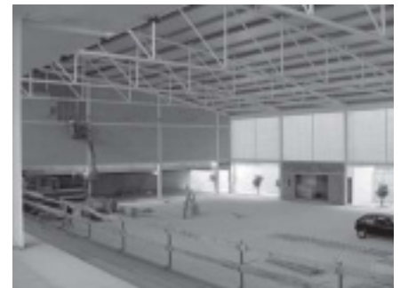
IMATGE DES DE LA GRADERIA DE L'INTERIOR DEL POLIESPORTIU MUNICIPAL

BOP (Butlletí Oficial de la Província) les BASES GENERALS I ESPECÍFIQUES QUE REGIRAN LES CONVOCATÒRIES DEL CONCURS LLIURE PER A LA CONTRACTACIÓ LABORAL TEMPORAL DE DIRECTOR DEL POLIESPORTIU I DE CONSERGE-MANTENIDOR.