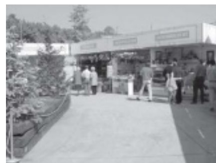
FIRA DE SANT PONÇ 2001

establiments aquest obsequis, que junt amb el record commemoratiu, l'entrepà de botifarra, el vi i el cava, es un bon motiu pel qual fa que la Trobada de Teià, gaudeixi d'un excel·lent prestigi dins la nostra comarca.