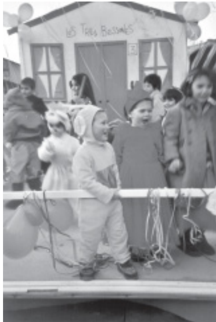
UN GRUP DE NENS I NENES DISFRESSATS AL CARNAVAL 2001

En aquest passats últims dies d'hivern, l'activitat cultural