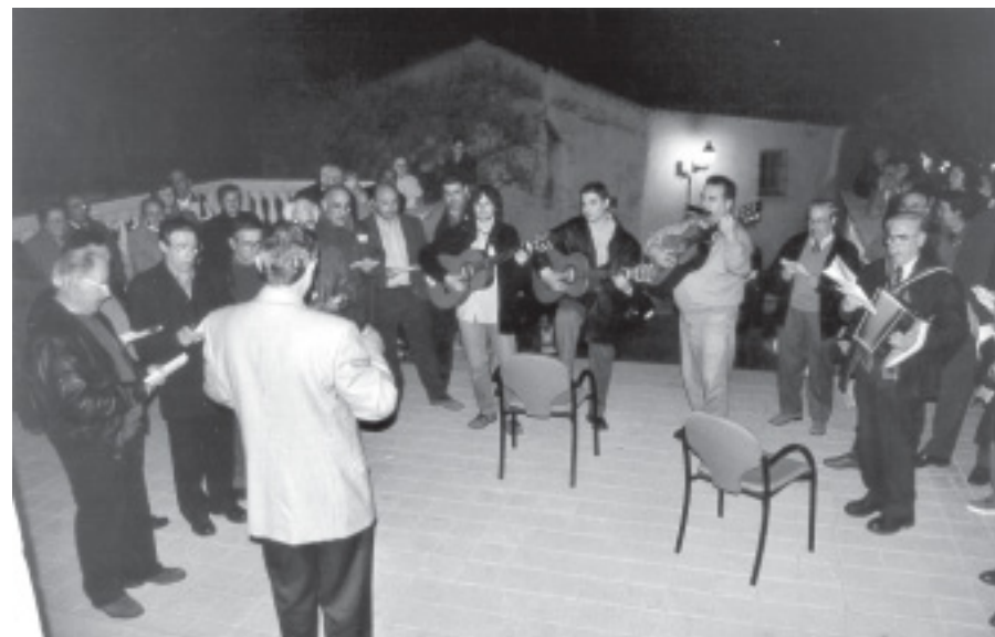
EL COR DE CAMELLES DE LA FLOR DE LA PALMA DAVANT L'AJUNTAMENT

disfresses, o bé a les cases de la gent que pel motiu que fós demanava que hi anessin a cantar. Aquestes cantades feien que el grup de caramelles passés tota la nit cantant i anés a dormir gairebé al migdia de l'endemà. Les caramelles eren en aquells moments molt seguides per la gent de Teià.