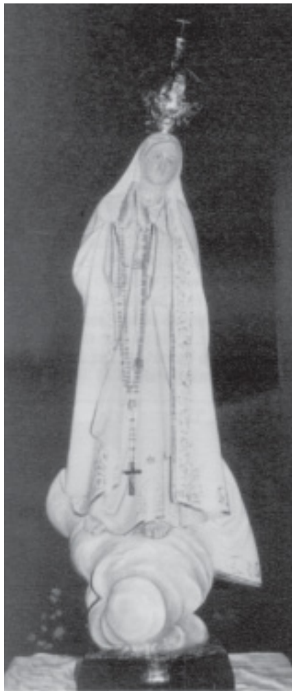
MARE DE DÉU DE FÀTIMA

Organitzar una exposició fotogràfica d'un fet esdevingut a Teià fa cinquanta anys no és tan sols el record d'un fet religiós, entra més a dins d'un fenomen social que ens permet una anàlisi de com era el nostre poble i la nostra gent a principis dels anys cinquanta. En visitar l'exposició, que per cert, hem vist desfilar majoritàriament teianencs nascuts al nostre poble o vinguts de joves, hem pogut copsar l'interès en veure-s'hi a ells mateixos, o familiars o amics. La relació d'amics o familiars en un poble d'uns 2000 habitants pot ser molt llarga.