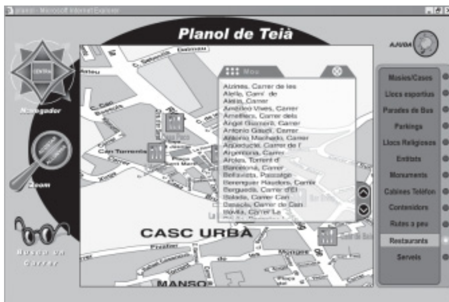
ENTORN GRÀFIC DEL PLANOL INTERACTIU DE TEIÀ. EL TROBAREU A WWW.TEIA.NET/AJUNTAMENT/PLANOL .