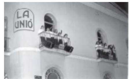
UN GRUP DE NENS I NENES DE LA CORAL EN LA REPRESENTACIÓ.

Per fer l'acte d'inauguració dels 12 anys, inaugurar la mateixa exposició i fer l'acte més festiu es va muntar un espectacle que s'anomenava "La casa per la finestra" i que era un espectacle fet a dins per ser vist des de fora, ja que la gent el veia des del carrer i l'actuació era a les finestres. A cada una s'hi representava un espectacle diferent que després s'anaven intercalant, (màgia pallasos, música) i en el portal central s'hi representa una acció dramàtica amb tot el grup d'intèrprets, tot