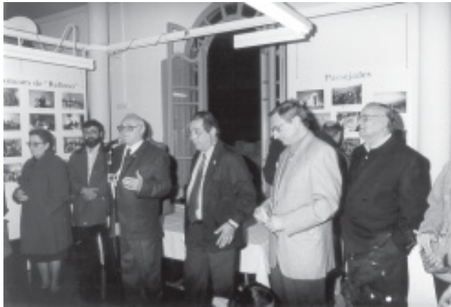
EL PATRONAT, L'ALCALDE I EL REGIDOR DE CULTURA INAUGUREN L'EXPOSICIÓ DELS 12 ANYS DE LA UNIÓ.

El dia 19 d'abril i com a començament dels actes de la setmana cultural de Sant Jordi, s'inaugurà a la Casa Municipal de Cultura l'exposició 12 ANYS DE LA UNIÓ 1989-2001.