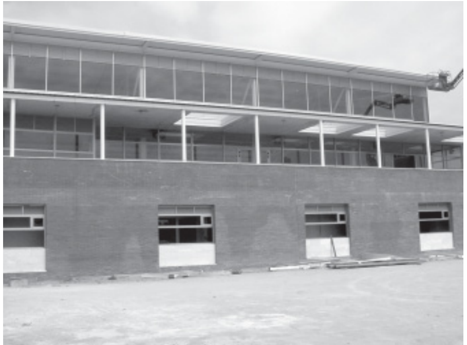
VISTA FRONTAL DEL POLIESPORTIU, EN OBRES.

El projecte del poliesportiu preveu 3 fases d'execució de les quals la segona és pràcticament acabada. La tercera fase, que correspon als equipaments, ja ha sortit a concurs públic i es calcula que finalitzi a mitjans del mes d'agost, per la qual cosa la propera temporada esportiva ja es podrà fer al polisportiu i si els nostres càlculs no fallen, és previst fer la inauguració del POLIESPORTIU MUNICIPAL EL CIM el dia 11 de setembre, diada nacional de Catalunya.