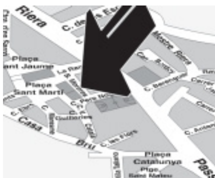
UNA FLETXA ENS MOSTRA LA UBICACIÓ D'UN CARRER DINS EL MAPA.

A més d'apropar i allunyar una situació dins del mapa o navegar per ell, ens pot arribar a mostrar els elements que hi ha en un lloc o carrer especificat, com poden ser restaurants, serveis municipals, esportius, religiosos, rutes a peu, pàrquings, cases importants, entitats, parades de bus, cabines telefòniques, monuments i fins i tot els contenidors de reciclatge que hi ha per qui tingui la necessitat d'utilitzar-los.