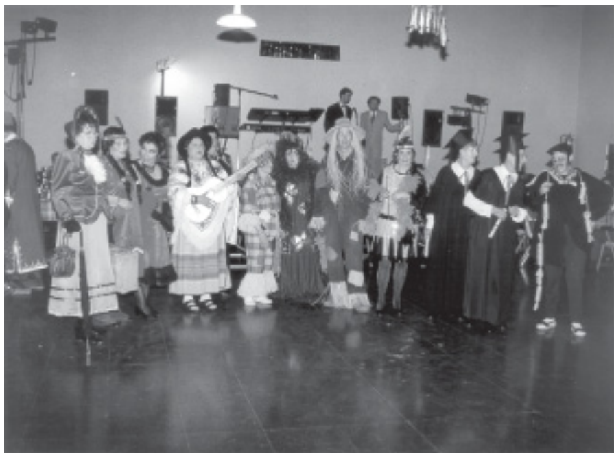
CARNESTOLTES 2001 A LA CMC LA UNIÓ

El conjunt CELONIS ens va deleitar amb tota classe de balls que varen