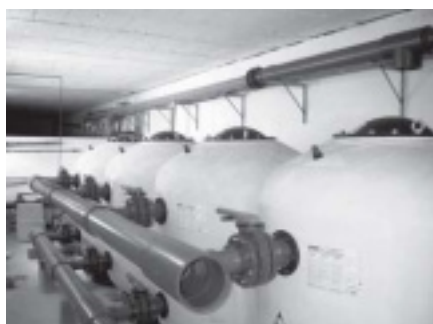
LA SALA DE MÀQUINES DE LES PISCINES MUNICIPALS, AMB LA SALA DE DEPURACIÓ REPARADA.

• A les piscines municipals s'ha reformat la sala de depuració. Una sala per a la maquinària i una altra per productes químics. També s'ha ampliat els equips de recirculació de la piscina gran per assolir un cabal de 140 m 3 / hora. La reforma té un cost de 3.875.000.- Pts.