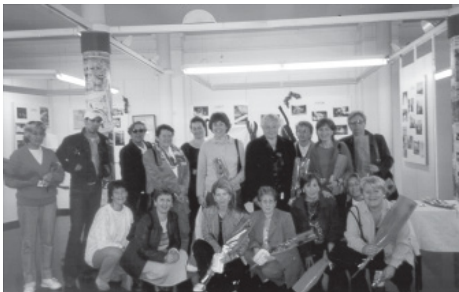
ELS PROFESSORS DE LA UNIÓ HOMENATJATS POSEN A LA FOTO DESPRÉS D'HAVER REBUT UNA PLACA COMMEMORATIVA.