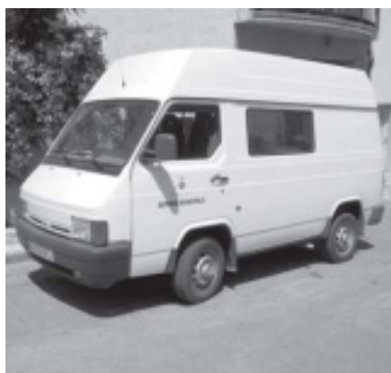
LA NOVA FURGONETA JA FORMA PART DE L'EQUIPAMENT DE LA BRIGADA MUNICIPAL PER EFECTUAR LES SEVES TASQUES

• A partir del mes de febrer la Brigada compta amb un vehicle nou, un Nissan Trade, ja que mancava per a les feines que s'estan realitzat cada dia més.