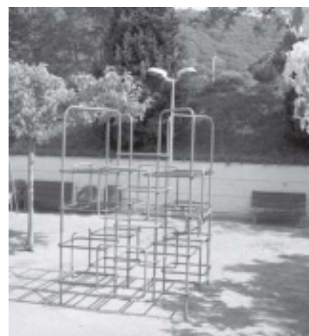
ELS DOS BANCS I EL PUNT DE LLUM ENTREMIG A LA ZONA DELS GRONXADORS DEL COMPLEX ESPORTIU MUNICIPAL.

• Al Complex esportiu Sant Berger, a la zona de jocs infantils s'han col·locat dos punts de llum nous així com també dos bancs