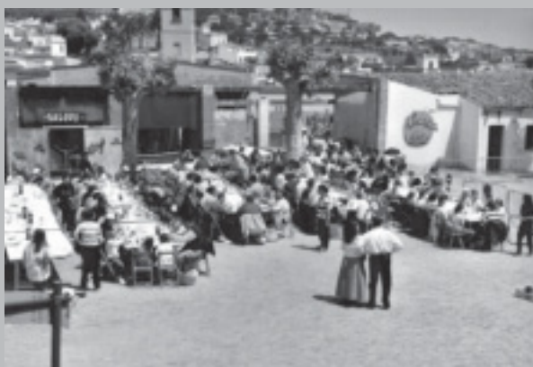
FESTA DE LA PRIMAVERA

poble que havia estat assaltat pels indis. Havien robat les escriptures dels terrenys!!!! Calia recuperar-les i finalment es van aconseguir. Al migdia, seguint la tradició, vam dinar