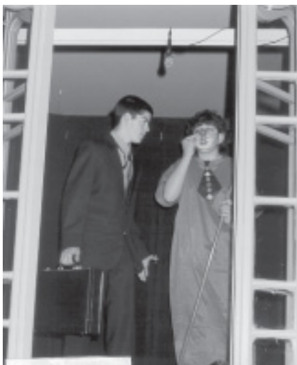
UNA PART DE LA REPRESENTACIÓ A LA INAUGURACIÓ DE LA UNIÓ.