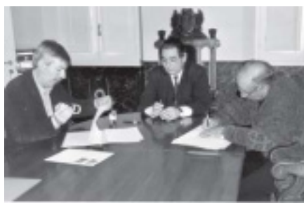
SIGNATURA DEL CONVENI DE CESSIÓ DE LA COOPERATIVA

El 14 de desembre del 2000, els pagesos varen convocar la assemblea general en la que entre d'altres temes, s'exposaria l'oferta de l'Ajuntament d'enderrocar l'actual local de la Cooperativa, per construir en aquest solar una residència per a la 3 a Edat, una dependència sanitària, un local social per l'Entitat i un pàrquing, amb la posterior remodelació de la plaça de Catalunya. Aquesta assemblea va tenir lloc, com estava previst, el dia 14 de desembre i resumint el seu contingut, aquesta