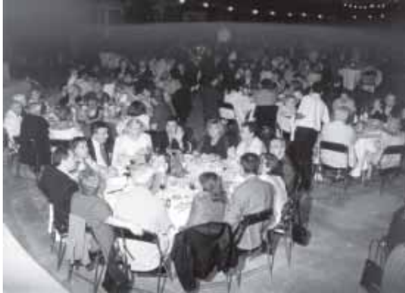
PLÈ TOTAL EN EL SOPAR DE LA REVETLLA

Gran assistència de públic, bon sopar, entorn agradable, servei excel·lent, orquestra i ganes de xerinxola