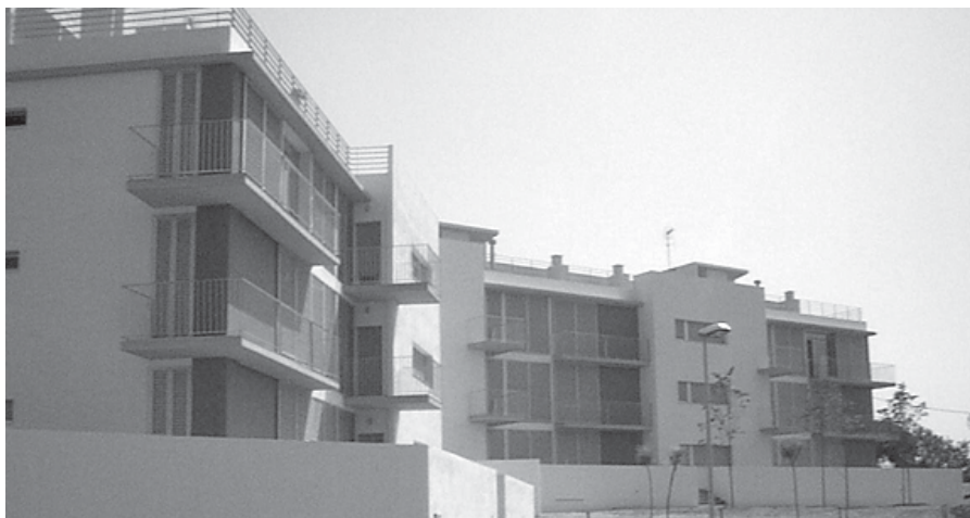
IMATGE DELS PISOS DES DEL CARRER VIOLETA

Els habitatges socials a preu taxat es van començar a construir a finals de l'any 1998, després de ser adjudicats per sorteig uns mesos abans.