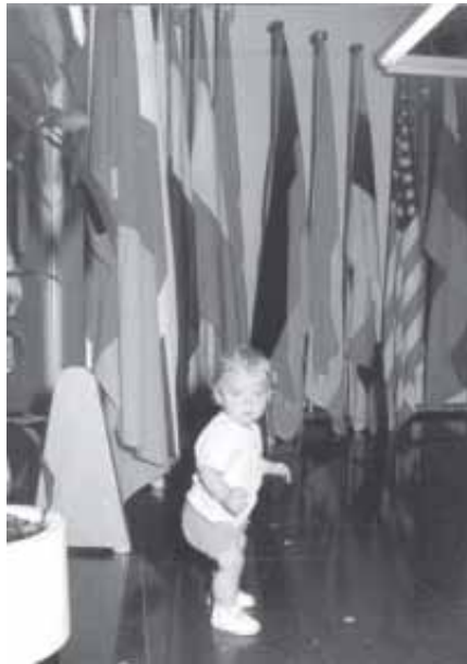
UN NEN, EL FUTUR DE LA NOVA GENERACIÓ DELS NOUINGUTS

Alemanya, Andorra, Argentina, Àustria, Bèlgica, Bulgària, Camerun, Canadà, Colòmbia, Dinamarca, Escòcia, França, Gàmbia, Guatemala,