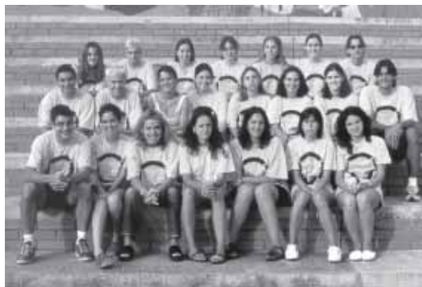
L'EQUIP DELS MONITORS DELS TALLERS AMB ALGUNES ABSÈNCIES

Esports, gimcanes, piscina, tallers, acampades i un total de 16 sortides amb autocar a diferents llocs de Catalunya per realitzar diferents activitats eren el pa de cada dia, és a dir, que no es perdia ni un minut. Com sempre, tot va acabar amb la festa final amb una guerra de bombardes i globus d'aigua i un espectacle realitzat pels mateixos nens i nenes.