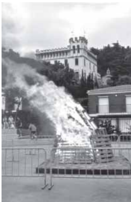
LA IMPRESSIONANT FOGUERA DE SANT JOAN AL PARC CAN GODÓ

De fet l'activitat de l'estiu va començar amb la celebració de la festa de Sant Joan, organitzat per aquesta regidoria el dia 23 de juny a la tarda, i com ja es tradicional va tenir lloc al Parc Can Godó l'encesa de la foguera de Sant Joan, per celebrar la festa Nacional del Països Catalans.