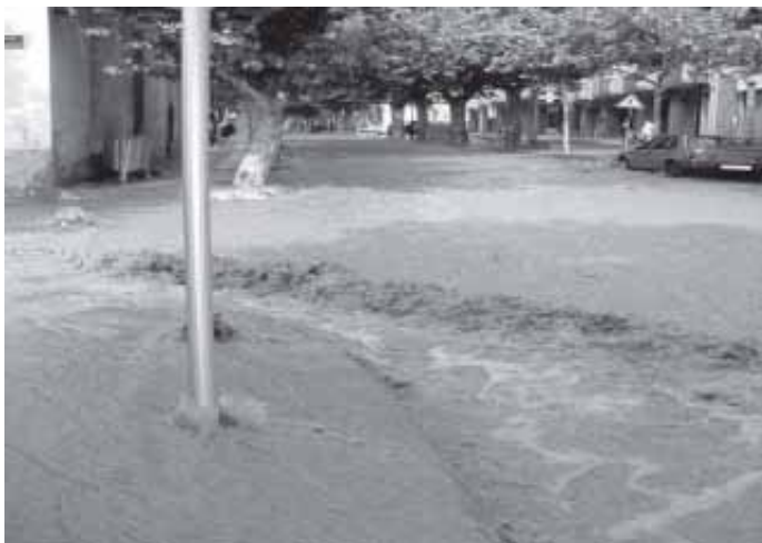
EL PASSAT 19 DE SETEMBRE, L'AIGUA PUJAVA PER SOBRE LES VORERES, TOT I QUE AQUESTES JA SÓN PROU ALTES.

davant. És per això que tots aquells que aparquen el cotxe a la riera, val la pena que mirin amunt o bé escoltin aquestes dies les previsions meteorològiques i feu cas a la Policia Local.