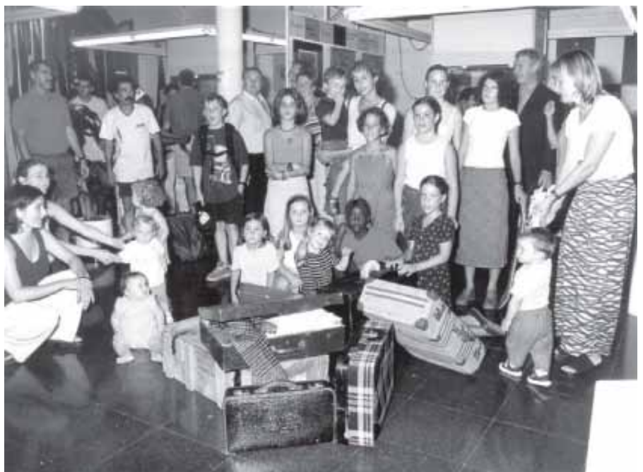
ASSISTENS A L'EXPOSICIÓ DARRERA UNES MALETES QUE REPRESENTEN EL VIATGE AL NOSTRE PAÍS.