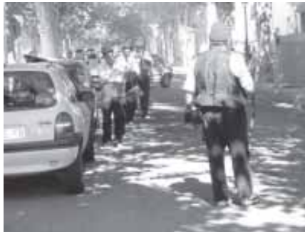
ELS TRABUCAIRES BAIXANT LA RIERA

Decididament la Diada Nacional de Catalunya d'enguany ha estat tot un èxit de participació, en els diferents actes celebrats, però el que és més significatiu, és el que fa referència realment a la Diada. Enguany es va inaugurar al Parc Can Godó, un monòlit en homenatge a Rafael Casanova un deute pendent del teianencs, però que a més, per la seva actuació amb els fets de l'11 de Setembre,