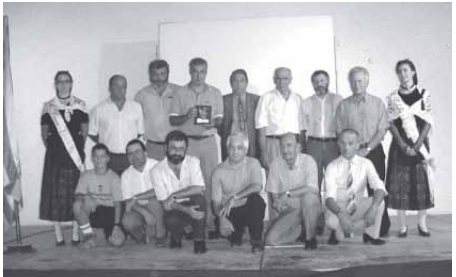
ELS MEMBRES DE L'ADF AMB EL TEI DE PLATA

Prenem nota per a l'any vinent d'organitzar millor aquest acte i aprofitar aquest magnífic lloc.