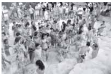
JOVENT DE TEIÀ EN UN REFRESCANT BANY D'ESCUMA

El diumenge dia 9 de juliol, va muntar-se al Parc Can Godó, com anys anteriors un conjunt