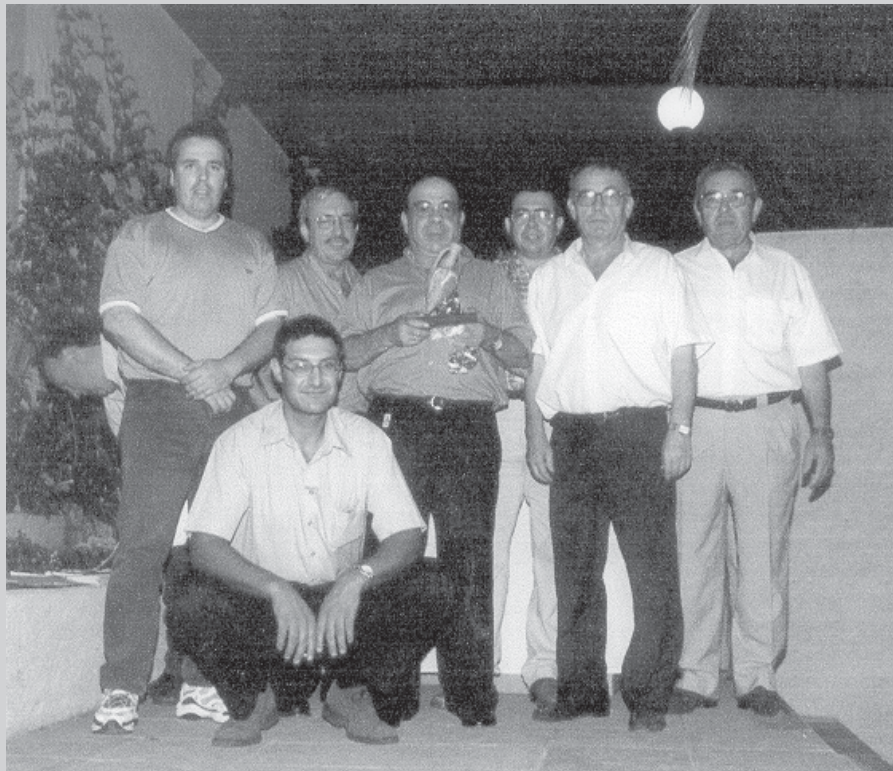
ENTREGA DE PREMIS DEL 1ER. CAMPIONAT VALLÈS-MARESME. 3ER CLASSIFICAT

El proper dia 12 de novembre de 2000, a la seu del nostre club es celebrarà el torneig de dòmino "SANT MARTÍ", emmarcat en les activitats amb motiu de la festa major.