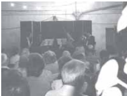
EL CONCERT D'EUTERPE CLASSIC ALS JARDINS DEL DR. MARIANO.

Enguany l'esmentat concert va tenir lloc al jardí de "Casa Dr. Mariano" el diumenge dia 10 de setembre a les 8 del vespre a càrrec de l'excel·lent Quartet EUTERPE CLÀSSIC.