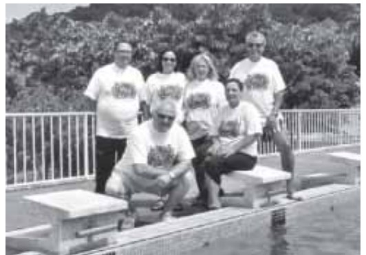
COL-LABORADORS DE LA CAMPANYA

La Fundació d'Esclerosi Múltiple amb la col·laboració de l'Ajuntament varen celebrar a la Piscina Municipal el dia del «MULLA'T», campanya destinada a recaptar fons per l'esmentada fundació. En total es varen recollir 95.400 pts., distribuïdes entre donatius, venda de samarretes i entrades. Donem les gràcies a tots els que varen participar i col·laborar.