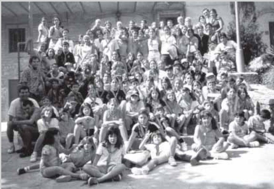
GRUP DE NENS I MONITORS DE L'ESPLAI, DE COLÒNIES

Equip de monitors i monitores de l'Esplai Itaca