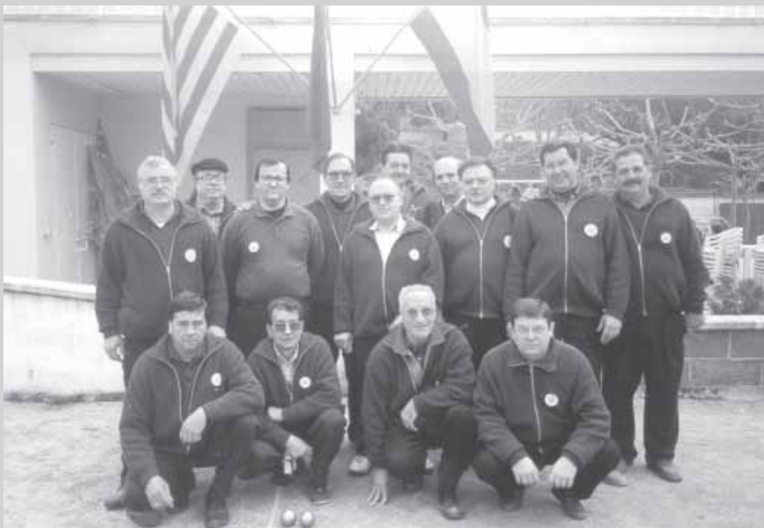
COMPONENTS DEL CLUB DE PETANCA DE TEIÀ

El col·lectiu de clubs de petanca ens espera i nosaltres acudim a aquesta lliga Provincial de petanca amb molta il·lusió per jugar aquesta temporada en una divisió superior a la de l'any anterior.