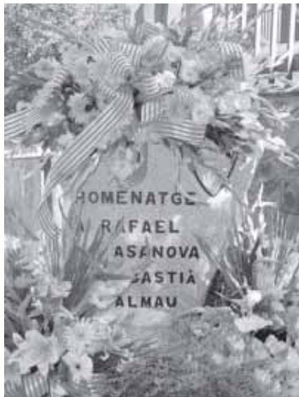
EL MONOLIT GAURNIT DE FLORS PELS PARTITS POLÍTICS DE TEIÀ

precisament per donar relleu a actes com el que aquest que ens ocupa.