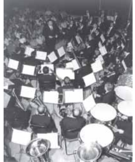
EL PÚBLIC ASSITENT AL CONCERT ES VA MOSTRAR COMPLAGUT

En qualsevol cas el concert va agradar molt, el públic va poder gaudir d'una bona nit, una bona música i d'un ambient excel·lent.