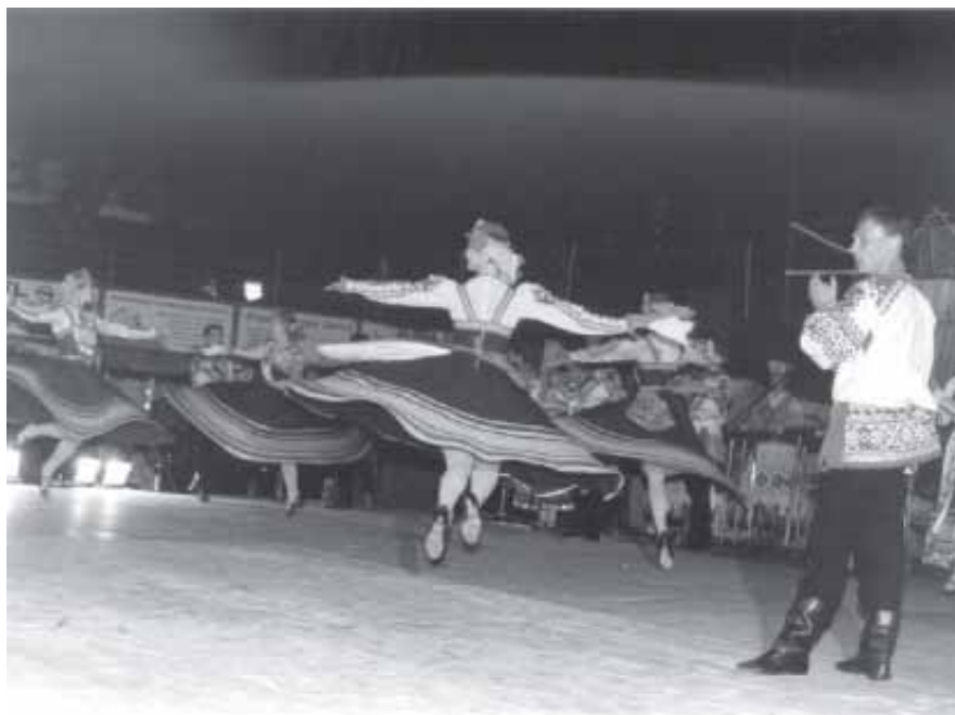
EL FANTÀSTIC BALLETS RUS VA ENTUSIAMAR AL PÚBLIC ASSISTENT.

Més de quatre-centes persones varen gaudir d'aquest espectacle, tot un èxit d'assistència. El grup també va quedar impressionat, ja que per motius que no vénen al cas, l'acte es va haver de