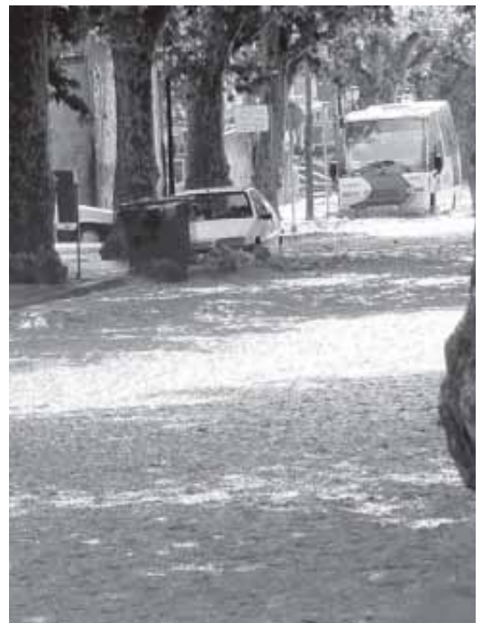
TRES COTXES VAN SER ARROSSEGATS PER L'AIGUA, QUE BAIXAVA AMB MOLTA FORÇA.