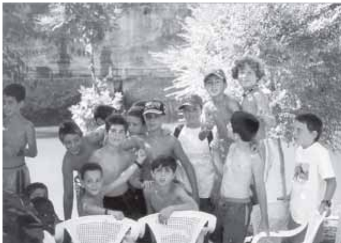
LA JA CONEGUDA EXCURSIÓ A NAVARCLES A REALITZAR ESPORTS D'AVENTURA

Aquest any i a diferència de les passades edicions, les activitats van durar quatre setmanes, en lloc de cinc, però que van fer que aquestes fóssin molt més aprofitades.