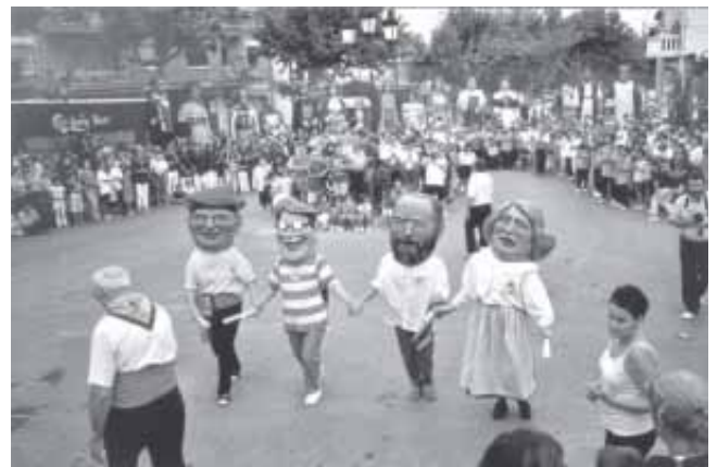
ELS CAPGROSSOS EN UNA BALLADA A LA PLAÇA DE CATALUNYA

molt bé, creiem que va ser tota una demostració per part de la Colla, d'organització i atenció als components de les colles, autoritats locals i altres convidats.