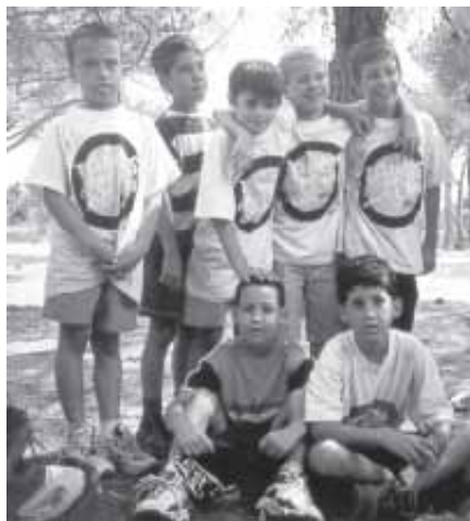
ACAMPADA A ST. MATEU

La seva organització, la dedicació dels monitors vers als nens i nenes, el nivell de les activitats, de les excursions, del menjador escolar i la seva alta qualitat a un preu relativament baix fan que els tallers siguin una alternativa de les més importants en el lleure durant el mes de juliol.