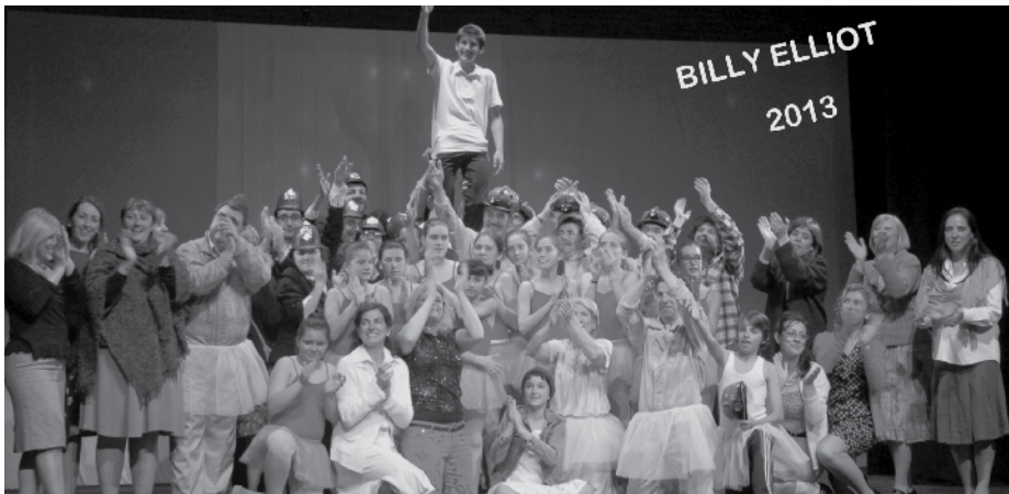
Els actors de Billy Elliot, al final de l'espectacle.