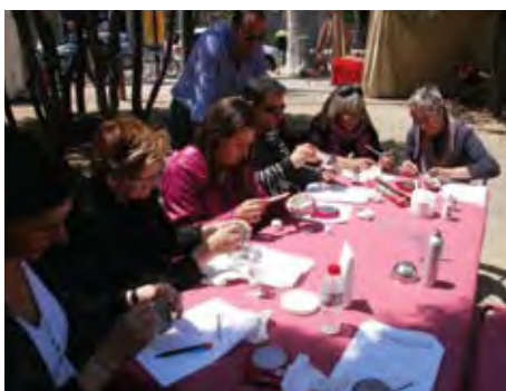
Taller de pastanaga de la Fira de Sant Ponç.