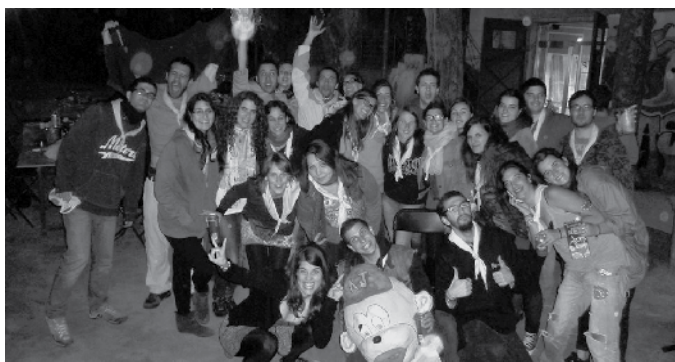
En COCO i els joves de Teià.

“La Prèvia”, no és més que un punt de trobada de joves de Teià on es fa un tastet del que a finals del mes d'agost serà la Setmana de la Joventut. Una trobada lúdica i d'intercanvi d'impressions entre joves per crear un bon ambient per als esdeveniments que els joves gaudiran en la Setmana de la Joventut i la Festa Major. Una molt bona iniciativa en què els joves van gestionar integrament el seu funcionament i van fer seu el Casal de Joves ASAC: un espai que hauran d'autogestionar i que estarà sempre a la seva disposició, que conservaran i adaptaran a les seves necessitats. Un símbol més que es creu en el jovent del poble. Gràcies, jovent!