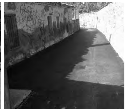
Carrer Folch i Torres.