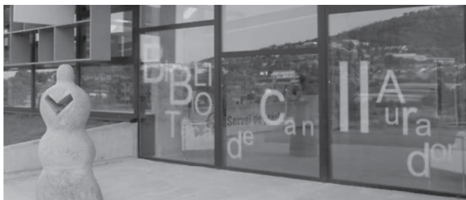
Premi per a la nostra biblioteca.

Aquesta edició ha volgut reconèixer la tasca de promoció lectora de la Biblioteca de Can Llaurador. La biblioteca rebrà un lot de 200 llibres infantils i juvenils, seleccionats entre les novetats de l'any. A més, totes les activitats guanyadores consten al cens d'activitats del Ministeri de Cultura, que permet difondre les activitats desenvolupades en l'àmbit del foment de la lectura.