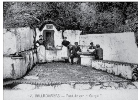
La font de can Gurguí a principis segle XX.