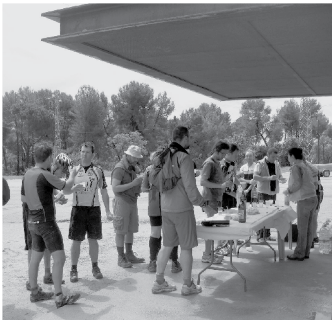
Parada per dinar a Sant Julià d'Altura.