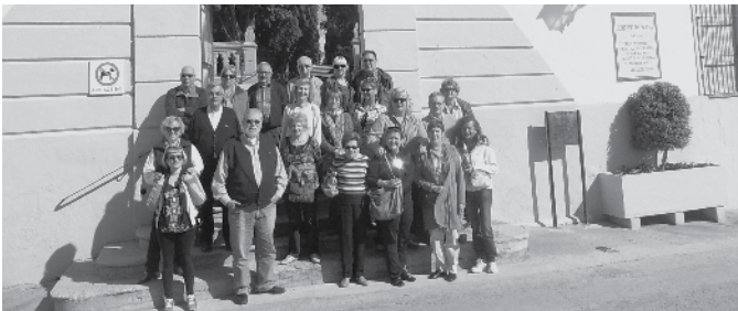
La Unió fa ruta, a Sinera.

Un any més, el mes de maig ha omplert la vila de Teià d'activitats culturals de tot tipus amb la Setmana Cultural i que enguany té com a centre neuràlgic, commemoració de l'Any Espriu, i moltes activitats han girat a l'entorn del poeta català. Les sortides culturals que es vénen organitzant des de la CMC La Unió, ens ha dut a una fantàstica visita guiada al mon Espriu de la vila d'Arenys de Mar, des del cementiri de Sinera i passant per indrets on la vida i obra del poeta hi és ben latent.