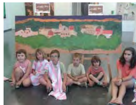
Participants en el Petit Poliedric.