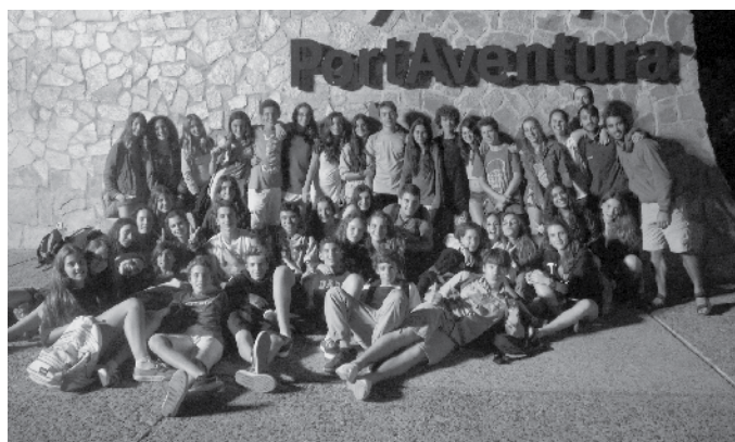
Una bona colla.