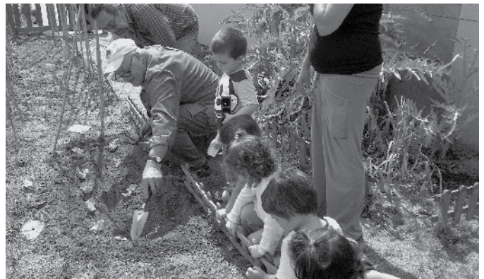
Voluntaris de l'ADF amb els nens dels Galamons.

Tot seguit a banda de conèixer diferents tipus d'enciams, en van poder plantar en testos i endur-se planter per fer-lo a casa.