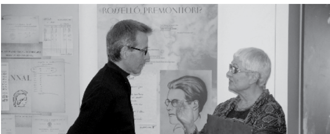
El Comissari, moments abans de la inauguració.

A més a més, durant la Setmana Cultural, La Unió ha acollit una exposició del poeta mallorquí Baltasar Rosselló-Pòrcel, coetani i amic d'Espriu i del que també se'n commemora el centenari del seu neixement i amb el que tingué moltes coincidències vitals i professionals. Una exposició que fou inaugurada pel seu comissari i que ens transportà a la vida d'ambdós poetes i a conèixer la Residència dels Estudiants de Catalunya, autèntic viver de grans noms de la literatura catalana.