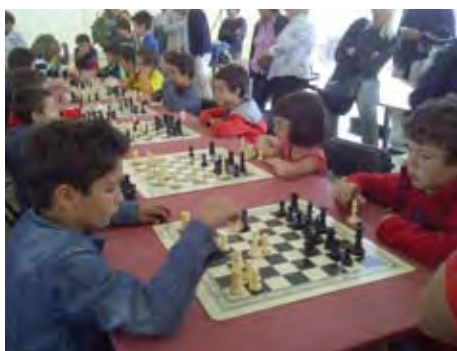
Torneig d'escacs de la Fira.