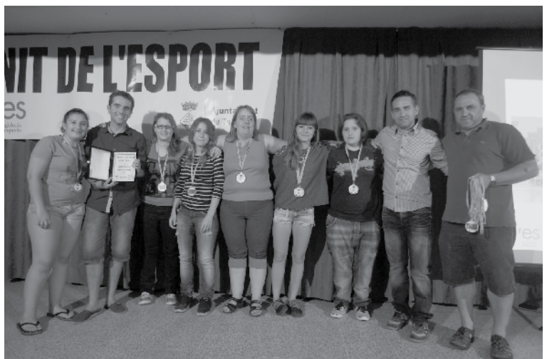
Equip adult més destacat: Sènior fèmines Teià Futbol 5