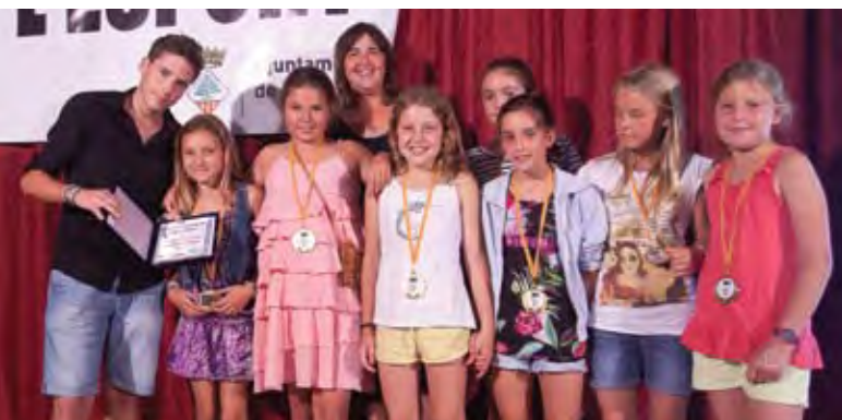
equip infantil més destacat: aleví femení Teià Futbol 5