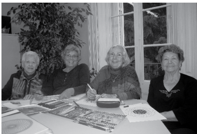
Taller de Mandales.