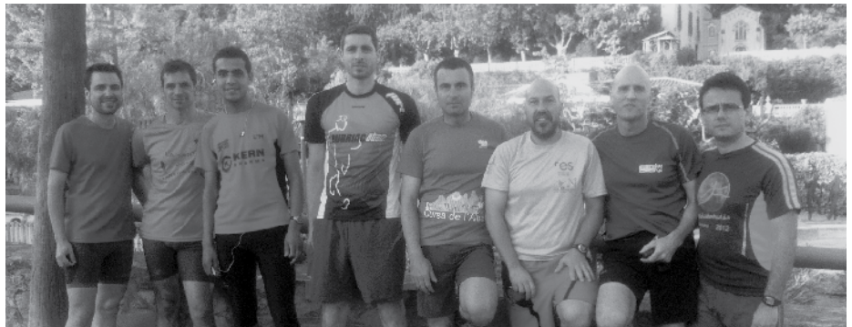
Un grup de corredors del CET, surt a córrer setmanalment.

Avui dia, el Club Excursionista de Teià ja té una secció que es dedica a aquest esport tan bonic però a la vegada tan dur. Som un grup de gent que portem uns quants anys practicant el "running" per la muntanya, ja sigui turó, pujol o pic d'alta muntanya. Ens preparam a consciència per subsistir les curses i poder arribar fins al final. Us ho diem perquè quan veiem les èlites, les volem imitar, però el que no es veu és la dura preparació a nivell d'entrenaments, dieta etc.. per aconseguir unes bones condicions físiques i psicològiques per tal de suportar les exigències de determinades curses, característiques de la muntanya i condicions climatològiques.. El primer que tot bon corredor ha de fer cada any és una prova d'esforç, per comprovar la seva capacitat física i poder detectar possibles problemes cardiovasculars, és evident que no tots tenim les mateixes condicions genètiques o físiques. Un cop fet això, començar a entrenar per la muntanya suau, sempre és recomanable un inici progressiu, per tal de conèixer els nostres límits i adaptar el cos a l'exercici. (Hi ha plans d'entrenaments que recomanen que es comenci caminant) consulteu aquest per fer-vos una idea: http://ropits.com/curses/iniciacio_correr.htm ). Quan estigieu una mica preparats, que us trobeu confortables pujant, afegiu-vos a un grup de córrer, és un