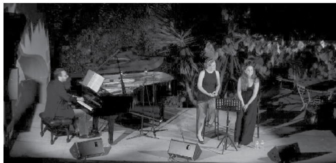
Musicals a Can Bruguera.

A més a més, enguany, s'hi celebra un recital poètic d'Espriu i solidari en benefici de Càritas Teià.