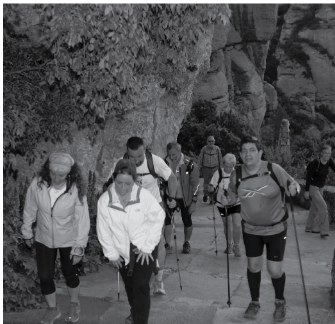
Arribada a Montserrat, entre el cansament i la il·lusió.