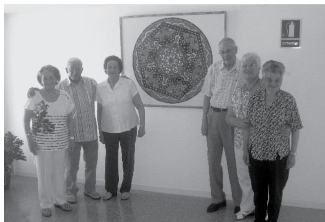
Mandala gran exposada al vestíbul dels pisos de gent gran.