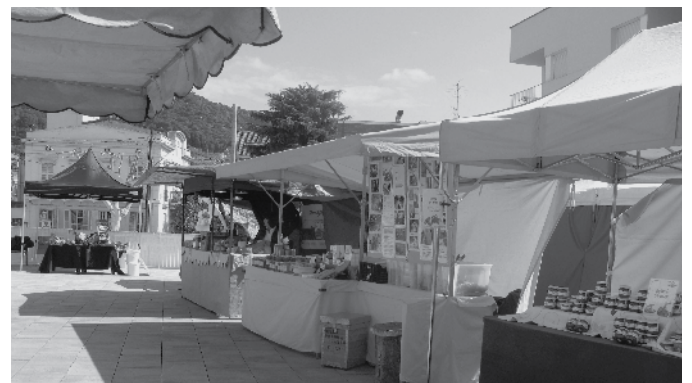
Mercat temàtic a la plaça de la Cooperativa.

El mes de juliol hi haurà un Mercat de Segona Mà i d'Intercanvi. Són moments difícils i ara més que mai hem de potenciar l'aprofitament de tot el que tenim, siguin coses físiques o sigui la feina que pots oferir a canvi de productes o d'altres necessitats.