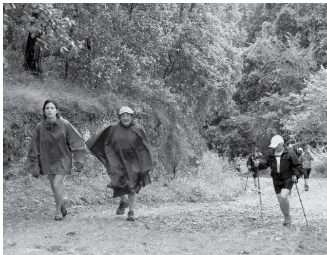
La pluja ens va acompanyar durant bona part del dia.

Per tal que la festa continuï i per fer partícip a tothom el pro-