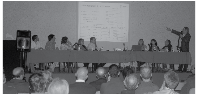
La sala d'actes de La Unió va acollir l'audiència.

Aproximadament unes 100 persones van assistir a l'acte, i van poder preguntar tots els dubtes que tenien sobre els temes tractats.