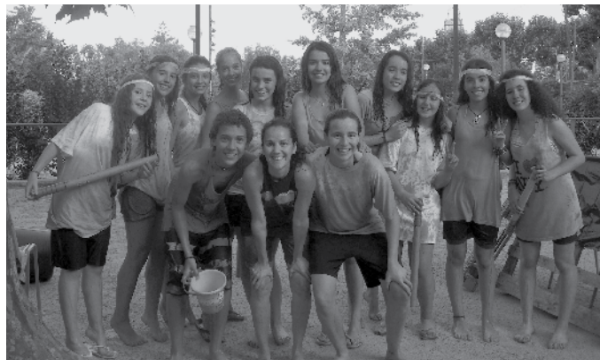
Fi de curs i final de batalla.

Joves, el curs que ve us oferirà nous reptes, noves activitats i un ambient A SAC!