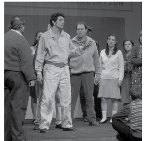
Els actors durant el musical.

El Billy Elliot del Grup Teatre de La Palma ha comptat amb actors veterans de primera fila del nostre brillant elenc, amb joves i prometedores incorporacions que albiren un engrescador panorama tea-