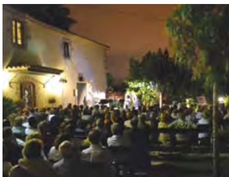
Remor 2013, concerts d'estiu.