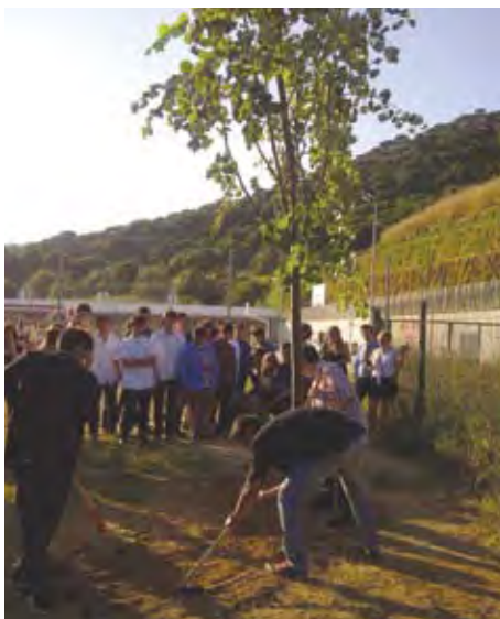
Plantada de l'arbre de la 4ª promoció del SES Turó d'en Baldiri