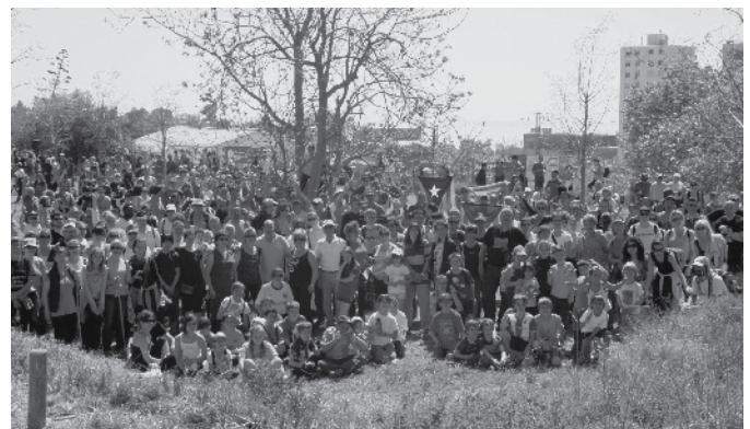
Foto de família dels participants dels tres pobles.

En aquesta 8a edició, varem ser 1.479 persones de les quals 392 d'Alella, 710 del Masnou i 377 de Teià, augmentant un 23% en termes absoluts, i amb un 40% més de gent que va sortir des de Teià, confirmant d'aquesta manera la caminada com una activitat potent i de referència dintre de l'àmbit esportiu municipal i comarcal.