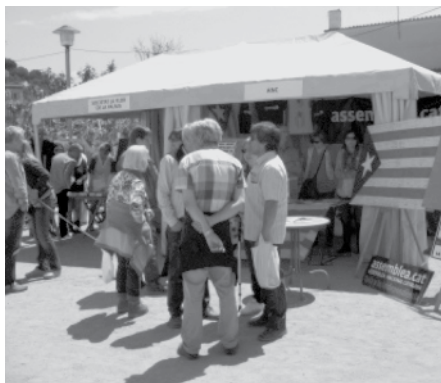
Fira de Sant Ponç

Per la fira de Sant Ponç de Teià, volíem estar en contacte amb vosaltres i animar-vos a construir entre tots una estelada on poguéssiu manifestar la vostra raó per voler la independència de Catalunya. I amb la vostra ajuda ja hem pogut recollir més de 120 raons. És una estelada entranyable que en properes ocasions la seguirem ampliant. Gràcies per la vostra col·laboració i el vostres donatius!