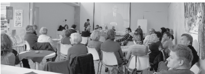
La Biblioteca homenatja Espriu, Rosselló i Raspall.

La Biblioteca Can Llaurador també ha participat activament en els actes de commemoració de la Setmana Cultural i de l'any Espriu en particular. En aquesta ocasió, la Marató poètica d'enguany ha estat dedicada a Espriu, Rosselló Pòrcel i a la poetessa vinculada al Masnou, Joana Raspall, que enguany fa 100 anys. S'hi han realitzat lectures i intervencions en altres disciplines artístiques per homenatjar als tres poetes.