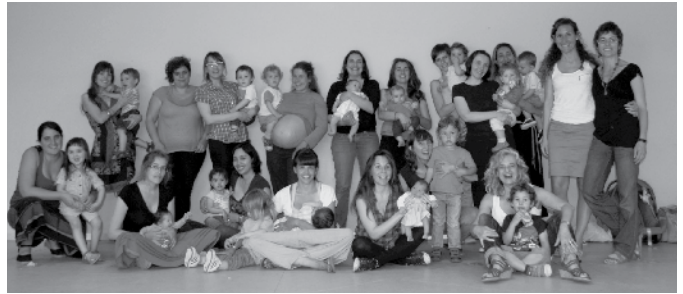
Celebració dels 5 anys del grup.

Ens podeu contactar a lactanciateia@yahoo.es