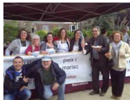
Sardinada oferta pel Mercat Municipal.

CURS ESCOLAR 2012-2013 Com es diu popularment una imatge val més que mil paraules, i per això us presentem algunes fotografies del curs escolar 2012-2013 que just ha finalitzat o finalitzarà en els propers dies.