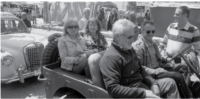
Vehicles antics van passejar durant la fira.

També volem destacar la participació i col·laboració de l'empresa Guies MB, que va muntar un circuit de Multi-aventura durant tot el cap de setmana, en el qual van poder participar 180 nenes i nens.