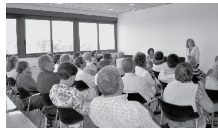
Club de lectura a la Cella Vinària.

Aquesta trobada conjunta, en un rerefons comú de tants segles enrere, de ben segur enriqué amb mirades diferents els 3 clubs de lectura.