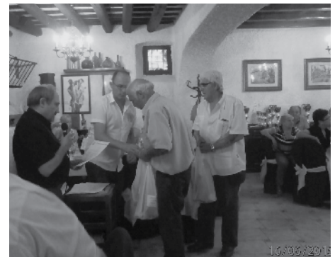
Dinar de germanor.

Ara, tenim unes petites vacances fins al setembre que començarà la lliga federada. Això no vol dir que no jugarem, sinó que continuarem tirant boles al Club, a les tardes. Ara amb el bon temps ve molt de gust, i si podem, anirem als torneigs de Festa Major que ens convidin altres clubs; per cert el dia 30 de juny tenim dues invitacions: una al Barri del Remei, que fan les 6 hores de petanca, i l'altra, al Ramon i Cajal que faran una "melé", totes dues per la Festa Major. Hi anirem a totes dues. Esperem portar algun premi al Club.