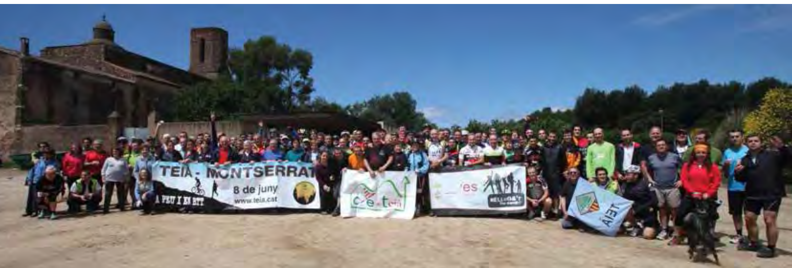
Teià - Montserrat..