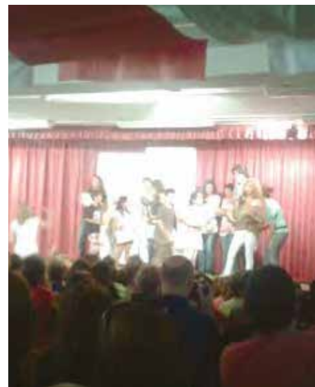
Festa dels Voluntaris.