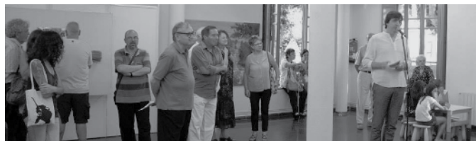
Inauguració del Teià Polièdric 2013.

El Teià Polièdric ha consumat una segona edició, i amb més energia que mai. En aquesta ocasió s'hi barregen artistes locals de diferents trajectòries: uns amb experiència en el món de l'art ben dilatada i altres que comencen la seva incursió en aquesta disciplina artística. El resultat és una mostra ben heterogènia i rica.