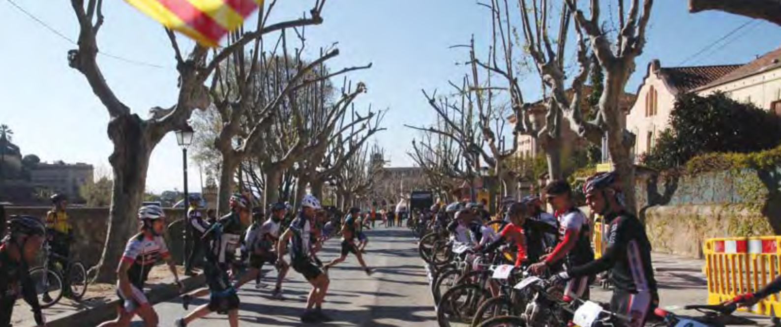
3h Resistencia en BTT