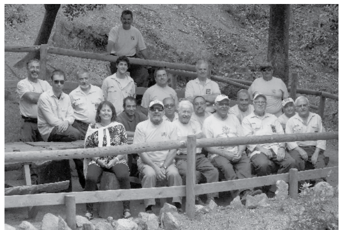
Foto inici de campanya.