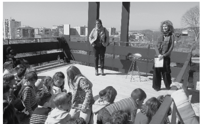
La cultura del vi, en versió infantil.