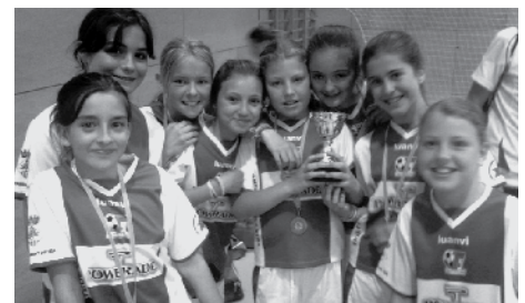
Aleví Femení del Teià F5.

D'aquesta manera, tanquem la temporada i iniciem la propera, la temporada 2013 - 2014, que s'endevina espectacular! Podeu formar part dels nostres equips, demanant informació a través del nostre e-mail teiafutbolcinc@gmail.com . A la propera temporada gaudirem de les següents categories: