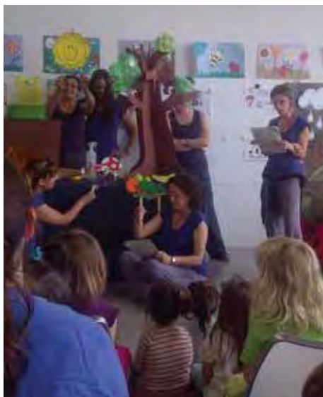
Conte explicat a la Biblioteca per les tutores de l'EB Els Galamons.

CURS ESCOLAR 2012-2013 Com es diu popularment una imatge val més que mil paraules, i per això us presentem algunes fotografies del curs escolar 2012-2013 que just ha finalitzat o finalitzarà en els propers dies.