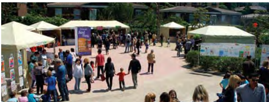
Fira de Sant Ponç.