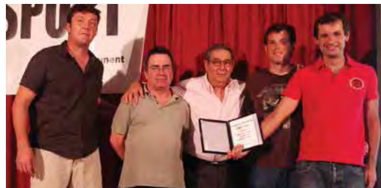
Fet més destacat 2012: 1r premi gaes btt (cet/re)