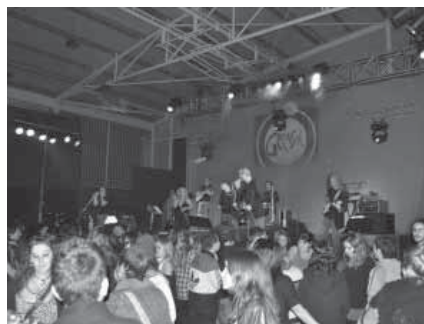
Concert Jove amb l'orquestra Girasol.