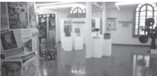
Imatges de dues de les exposicions del Gramc.