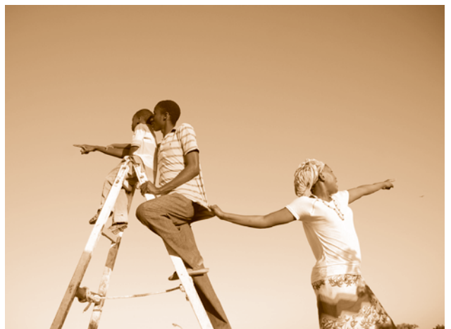
Caricaturitzant el nou monument.