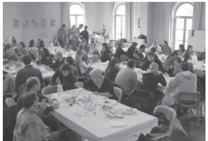
Vista general del dinar popular.