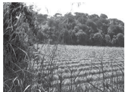
"Vinyes dins la natura" d'Enriqueta Guasch.