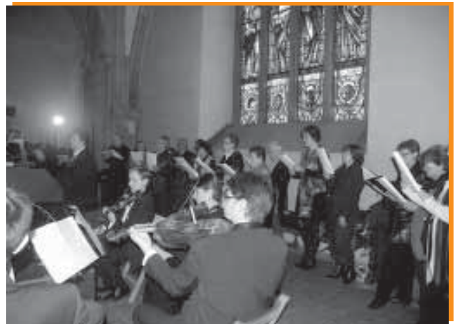
El Cor Parroquial a la Missa Solemne de Sant Martí.