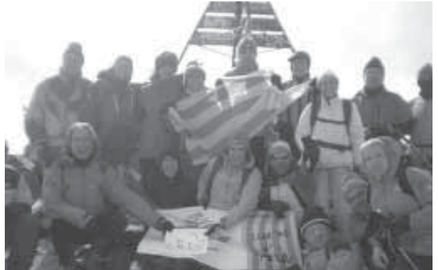
Membres del CET al cim, a 4.167m.

L'expedició teianenca, formada per 21 socis del CET, va sortir del poble el dijous 7 d'octubre. Després d'una primera nit al poblet d'Imlil (Marrakech), just al peu de la muntanya, vam fer via cap al refugi, situat a 3200 metres. Fou una llarga caminada amb 1600 metres de desnivell i uns 15 km de distància. Déu n'hi do. Dissabte 9 d'octubre, cap a les 11 del matí (hora catalana) els alpinistes assolíem el punt més alt del cim del Toubkal, 4167 metres. Punes est i oest per bona part dels muntanyencs. El fred i el vent però ens van impedir estar gaire estona al Cim. Al migdia arribàvem novament al refugi després d'un lent descens, fruit del cansament i de la dificultat del camí, ple de pedres. Les cares de satisfacció, però, eren més que evidents. Al vespre vam tenir la sort i el plaer de veure, en mirar el cel, un munt d'estrelles i, al bell mig de la negror, una gran estela, la Via Làctia. Una imatge que val més que mil paraules. Ja diumenge arribàvem a Marrakech, la civilització, per dir-ho d'alguna manera on, durant dia i mig, vam canviar la muntanya pel turisme. El Cim del Toubkal doncs, passa a ser un més dels espectaculars cims assolits pel Club Excursionista Teià.