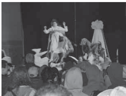
Performance inicial al Correfoc.