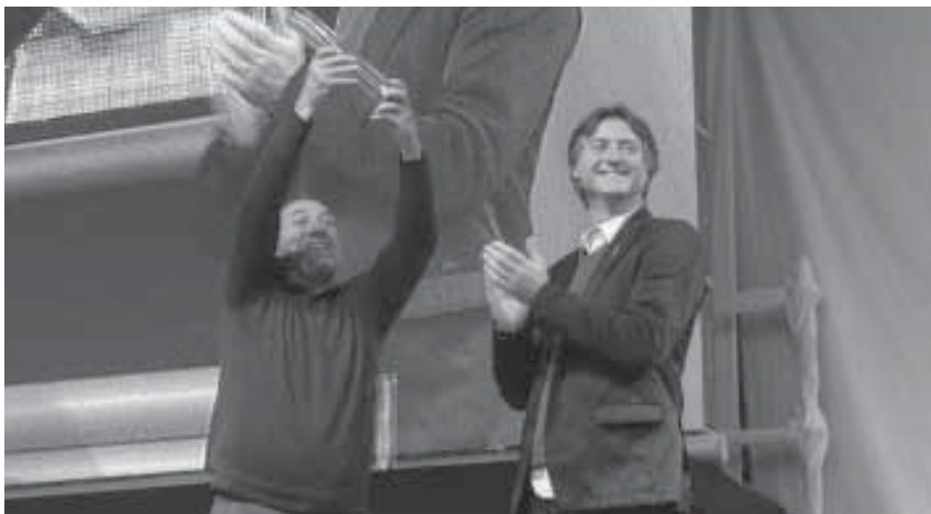
Moment en que l'ADF Teià recull l'accèssit al premi Palestra.