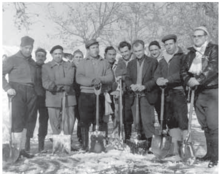
Teianencs que estaven traient neu de la Riera. 1962.

Ens contaren amb orgull que la gent de Teià fou la que alliberà a les monges de les "Escolàpies" que restaven incomunicades al convent situat a tocar de la carretera de Teià, en ple cor del Masnou.