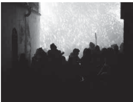
Teià en flames.