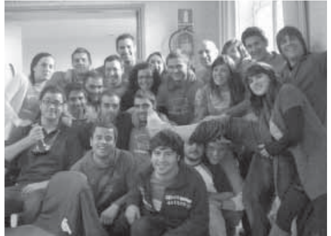
Els Garrins de Teià.