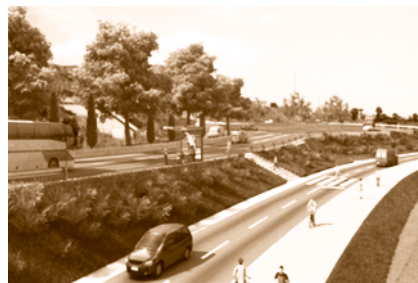
Projecte de la nova Ronda Maresme.

En cas que les propostes anteriors no siguin estimades pel Departament, i l'aprovació de l'Estudi informatiu i d'impacte ambiental de la Ronda Maresme segueixi la seva tramitació, reclamem que, com a mínim, pel que fa al municipi de Teià, es minimitzi l'impacte sobre el territori, però sobretot, sobre les persones afectades. Per això, l'Ajuntament de Teià ha presentat les al·legacions que a continuació resumim: