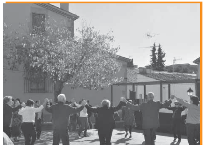
Ballada de sardanes durant el concurs de relleño.