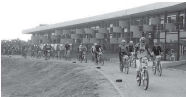
La Teialada al seu pas per la Biblioteca de Can Llaurador.