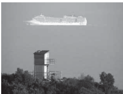
"Mediterrani" de Jordi Ribas.