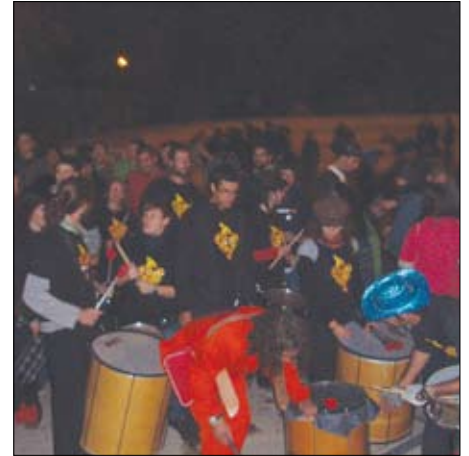
Batucada al Parc de Can Godó.