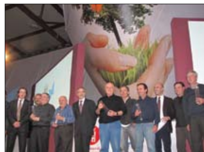
Els guanyadors dels Premis de Prevenció d'Incendis Forestals