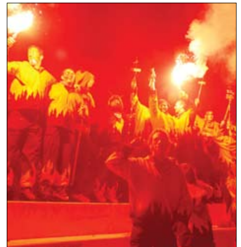
La Colla de Dimonis celebrant la fi del Correfoc.