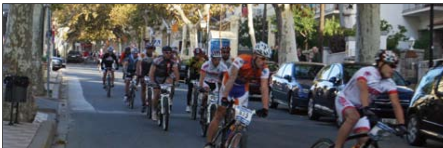
Grup de participants baixant per la Riera.

El passat 15 de novembre, dins els actes de la Festa Major, el CET i la seva secció de BTT van organitzar per sisè any consecutiu la Pedalada Popular, aquesta edició batejada amb el nom de “Teialada”.