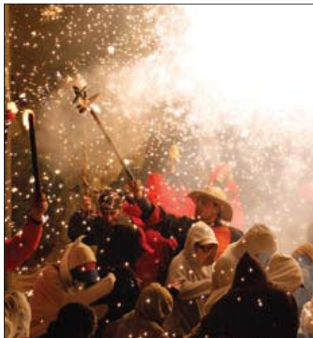
Els Dimonis durant el Correfoc de Festa Major.