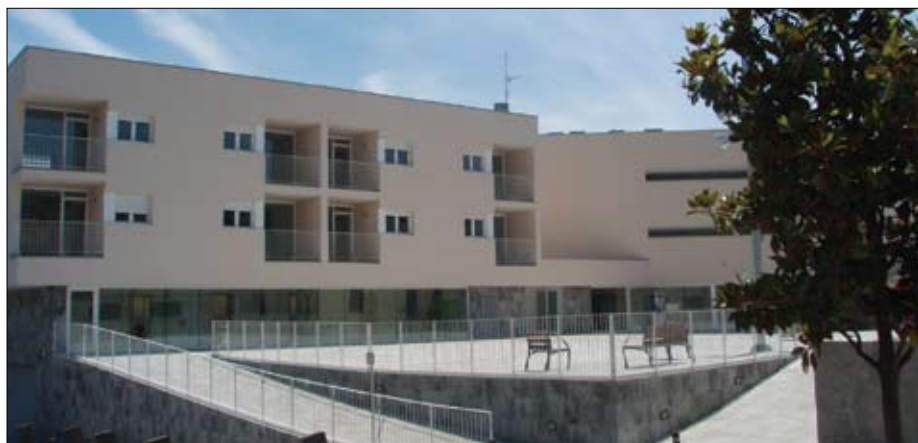
Nous equipaments per a gent gran de la Plaça Catalunya.

El local o centre d'atenció diürn ha d'acollir els serveis de menjador (office cuina), bugaderia, servei domèstic: neteja i manteniment de la llar, fisioteràpia i rehabilitació, teràpia ocupacional i cognitiva, podologia i perruqueria. Aquests serveis, de caire públic, s'oferiran, als usuaris i usuàri-