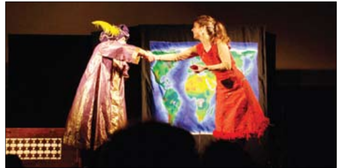
Tanaka Teatre fent el Pregó de Festa Major.

Vam començar divendres amb el Taller de Construcció de Jocs de Taula organitzat pel GRAMC, l'Exhibició d'Style dance al Poliesportiu Municipal i la inauguració de l'exposició "Prohibida l'entrada dels grans no acompanyats per un nen...", exposició que ha comptat amb la participació de diversos artistes teianencs, als qui agraïm tota la tasca que posteriorment han desenvolupat amb l'escola El Cim. El pregó, organitzat per Tanaka Teatre, va marcar el tret de sortida que va donar pas a la festa jove! Moltes butifarres, molts gots de la Festa Major, moltes disfresses i molta gresca van acompanyar el Cercatasques i van omplir els carrers de Teià i del Poliesportiu amb l'Orquestra Aigua Karme. Felicitats Comissió de Joves!