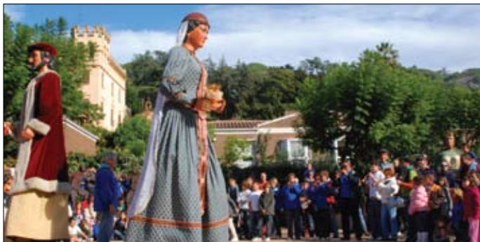
Trobada de Gegants al Parc de Can Godó.