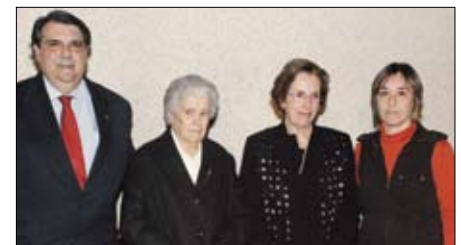
L'alcalde de Teià i la regidora de Cultura amb les homenatjades.