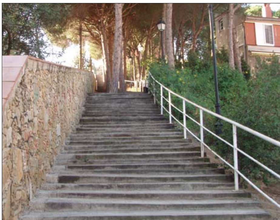
Arranjament de les escales que van del carrer Tossal al carrer dels Pins.