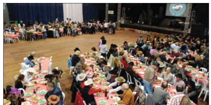
Sopar Teiawest al Poliesportiu Municipal.

I som-hi cap al Sopar Teiawest! Prop de 250 persones que van pujar al Poliesportiu i van gaudir de la decoració, l'ambientació i del menjar. En acabar, tots a ballar amb l'Orquestra Swing Latino i el seu espectacular muntatge.