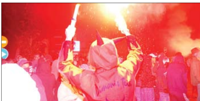
La Colla de Dimonis durant el Correfoc.