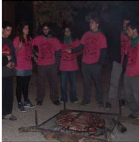
La Comissió Jove preparant el sopar abans del Cercatasques.