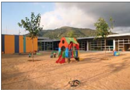
Escola Bressol Municipal Els Galamons.

L'ESPAI JUGUEM EN FAMÍLIA: Un espai de joc per a mares i pares juntament amb els seus fills i filles entre 1 i 2 anys