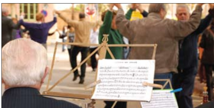
Ballada de sardanes al carrer Pere Noguera.

Diumenge li va tocar el torn a la XXIII Trobada de Gegants: cervavila i ballada de gegants que van omplir els carrers i el Parc de Can Godó. El Torneig de Dòmino de Sant Martí, amb un bon número d'inscripcions, i el Concurs de Pintura Ràpida. I, un cop dinats, cap a la Festa Popular: xocolatada, jocs i la companyia de "La Tresca i la Verdesca", que van fer passar a menuts i grans una estona divertida. Mentre, els més grans, gaudien a la CMC La Unió d'un espectacle de ball amb berenar, organitzat pel Casal de la Gent Gran de Teià.