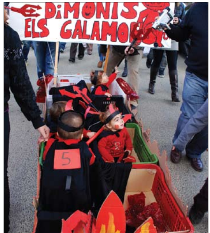
Baixada de Vehicles sense motor pel Passeig de la Riera.

Tallers, exhibicions, teatre, cercatasques, concerts, passejada popular, baixada de vehicles sense motor, bombardes, correfoc, sopars, gegants i capgrossos, sardanes, concurs de relleu, Teialada, Homenatge a la Velleja, Tei de Plata, etc.