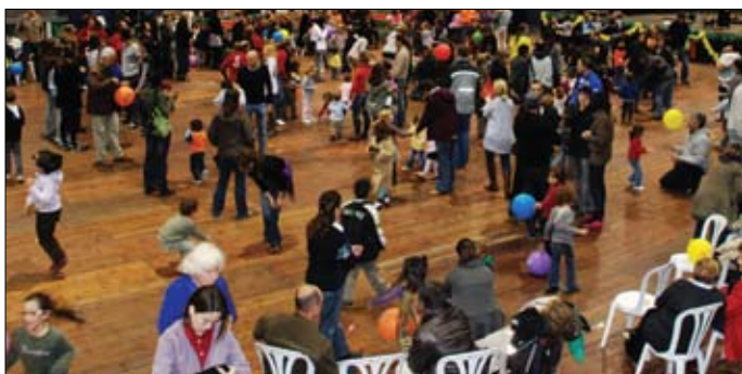
Festa Popular al Poliesportiu Municipal.