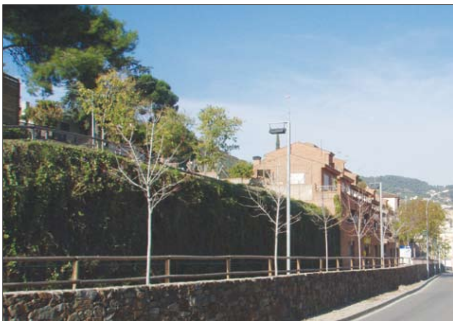
Millora de l'accés al nucli urbà per l'avinguda Roca Suàrez Llanos, al sector de Correus.

Amb l'objectiu de la creació de llocs de treball que minoressin la constant caiguda d'ocupació i augmentar la inversió pública municipal, el Ministeri d'Administracions Públiques va dotar un Fons Estatal d'Inversió Local de 8.000 milions d'euros destinats a inversions als municipis. En el cas de Teià li van correspondre 1.056.443 euros, quantitat estipulada segons el nombre d'habitants de cada municipi.