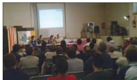
Primera reunió per posar en marxa la iniciativa.

Els eixos que es va marcar la Comissió Ciutadana Organitzadora aquell dia van ser bàsicament dos. El primer és que s'està organitzant una consulta popular per fomentar el dret a